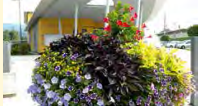
Blumenschmuck - Gemeindeamt