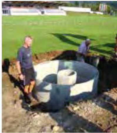
Errichtung der Fundamente