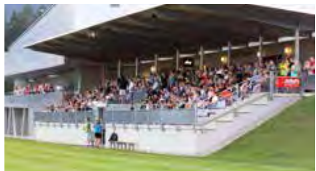
über 300 Gäste konnten zur Eröffnung begrüßt werden