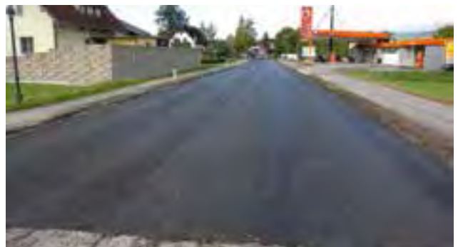
Beginn der Asphaltierungsarbeiten in Freßnitz