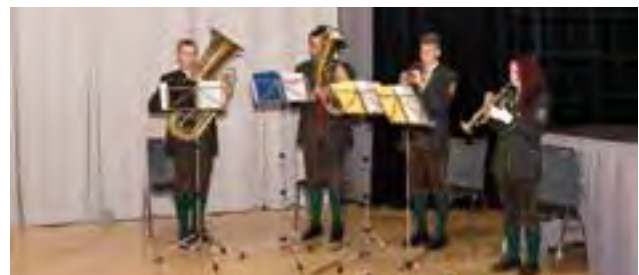
Bläserensemble der örtlichen Musikkapelle