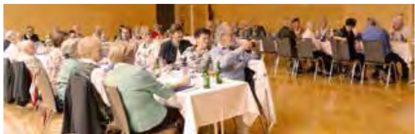
Jubilarfeier im Juli