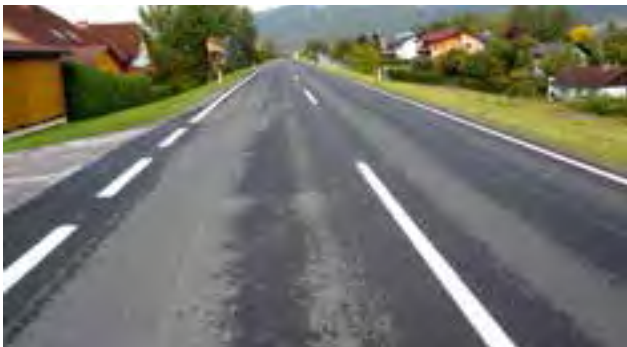
Abschluss der Sanierungsarbeiten mit dem Aufbringen der Dünnschichtdecke - B 72 (Umfahrung Aichfeld)

Der bestehende, sanierungsbedürftige Asphaltbelag wurde abgefräst, der Untergrund erneuert und die gesamte Fahrbahn mit einem neuen Asphaltbelag versehen.