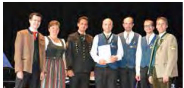
Marschwertung - Urkundenüberreichung an MV Langenwang