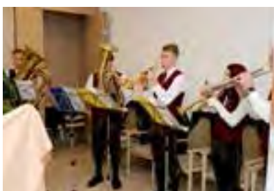
musikalische Umrahmung des Festakts

Zwei wunderschöne Atrien sorgen mittels Glasdach für ausreichend natürliche Belichtung in allen Geschoßen. Begrünt und ausgestattet mit zahlreichen Sitzgelegenheiten können die Atrien aufgrund ihrer hochwertigen Ausstattung (Überdachung, Fußbodenheizung, etc.) das ganze Jahr über von den Bewohnern und Besuchern genutzt werden. Auch die liebevolle Außengestaltung und Bepflanzung rund um das Haus suchen ihresgleichen.