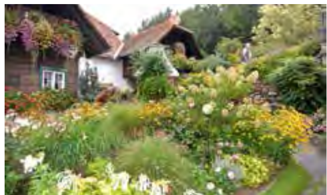
Bauernhof der Familie Fodermayer