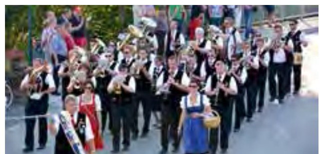
Musikverein Kittsee (Burgenland)