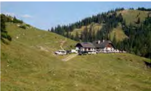
das herrliche Panorama auf der Kleinveitsch-Alm

Für die herzliche Aufnahme und die Möglichkeit diesen Ausflug durchführen zu können, bedanken wir uns bei Familie Posch und allen Almverantwortlichen.