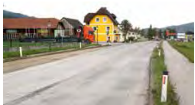
Abfräsen der sanierungsbedürftigen Asphaltdecke Teilbereich B 72 - Nähe Fa. Lidl bis Kreisverkehr Mitterdorf