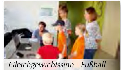
Gleichgewichtssinn | Fußball