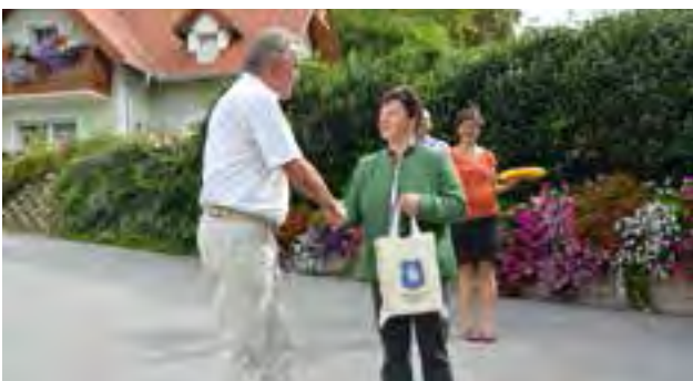
Begrüßung durch den Inhaber der Pension Luisenheim in Laßnitzhöhe

Male als Landessieger in der Kategorie „schönster Bauernhof“ hervorging. Die Krieglacherinnen und Krieglacher waren von der Blumenpracht beim Teibingerhof sehr beeindruckt und man konnte sich wiederum einige Tipps holen bzw. Ideen über die Gestaltung im eigenen Garten mit nach Hause nehmen. Die Tropenausstellung – ebenfalls bei Familie Teibinger – war das nächste Ziel der Reisegruppe aus Krieglach. Bei dieser Ausstellung konnte man Kunstwerke, antike Waffen und vieles mehr aus fernen Ländern bewundern. Diese Sammlung