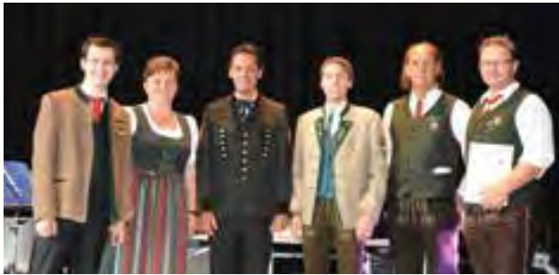
Marschwertung - Urkundenüberreichung an TMV Spital am Semmering