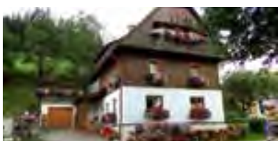
Fam. Schwaiger vlg. Gregorbauer