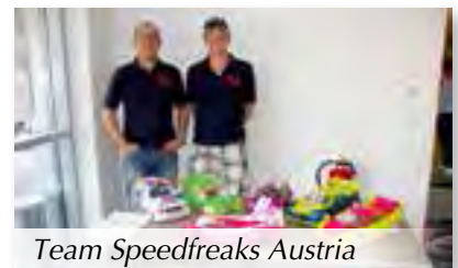
Team Speedfreaks Austria

Die Besucher zeigten großes Interesse und hatten großen Spaß mit dem Angebot der örtlichen Sportvereine bzw. Institutionen. So mancher Besucher, der noch keinem Krieglacher Verein angehört, könnte durch diese Veranstaltung zur Mitgliedschaft bzw. zur aktiven Vereinsarbeit