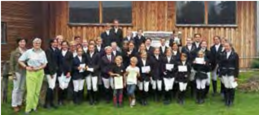
Reiterprüfungen Juli 2015