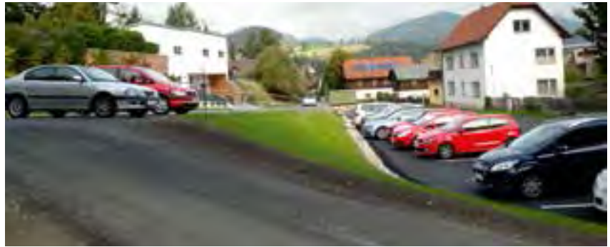
neu geschaffene Parkplätze mit Verbindungsweg

Im Zuge der Neuerrichtung des Bezirkspflegeheimes wurde auch der Bereich zwischen dem Trafo und der Brücke der Umfahungsstraße neu gestaltet und insgesamt 50 gekennzeichnete Parkplätze errichtet . Dadurch stehen genügend Parkplätze für die Besucher des Bezirkspflegeheimes in unmittelbarer Nähe zur Verfügung.