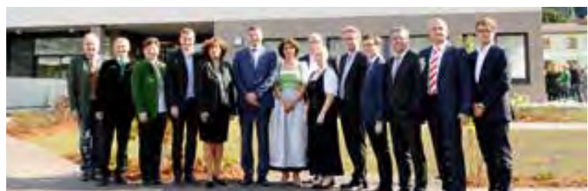
die Ehrengäste mit den Heimverantwortlichen