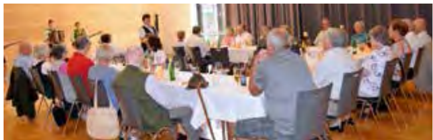
Jubilarfeier im August

Die musikalische Umrahmung wird über Herrn Musikschuldi-