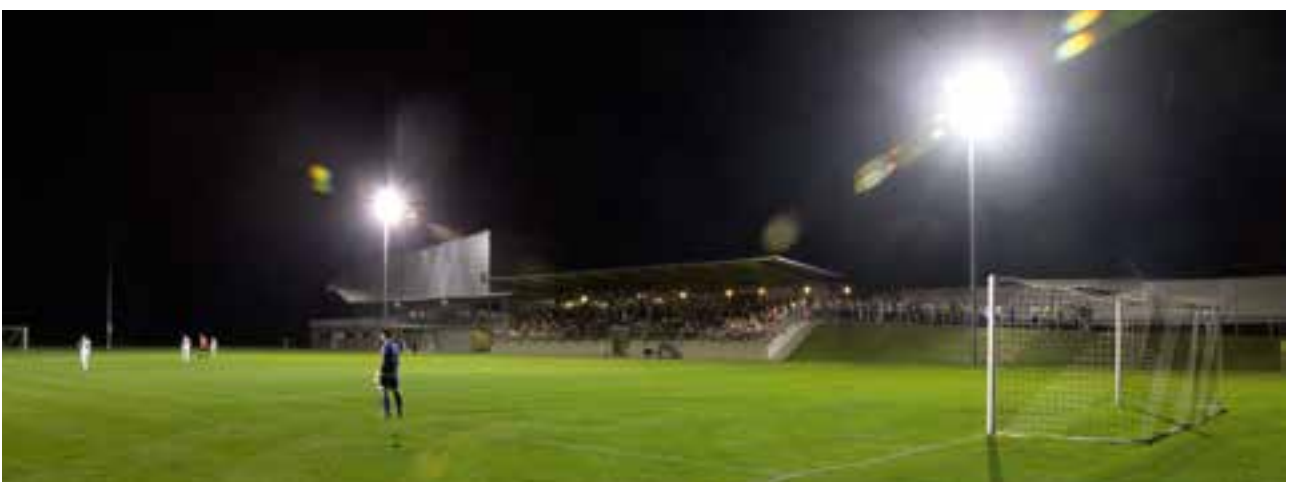
erstes Meisterschaftsspiel bei Flutlicht