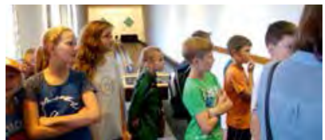
gemütlicher Abschluss beim Kegeln