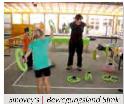
Smovey's | Bewegungsland Stmk.