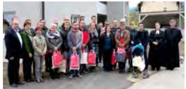
Schlüsselübergabe an die neuen Mieter