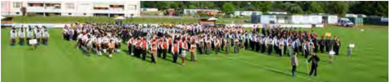
Aufmarsch aller Musikkapellen zum Festakt im Sportzentrum

Am Samstag, dem 11. Juli fand das Musikerfest in Krieglach mit Marschwertung & Bezirksmusikertreffen statt.