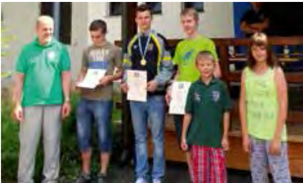
Siegerehrung LM 50m 40 Schuss Stehend