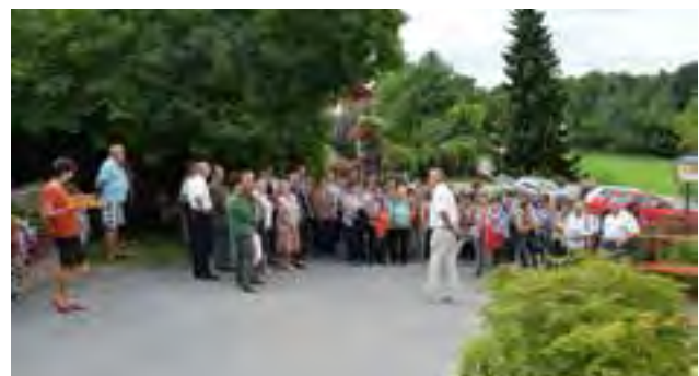
die Krieglacher Reisegruppe in Laßnitzhöhe