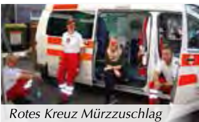
Rotes Kreuz Mürzzuschlag