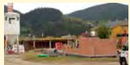
Baubeginn am Brahmweg

angeboten. Mit diesen Gebäuden entsteht weiterer, wertvoller und moderner Wohnraum im Brahmweg und wir danken der Siedlungsgenossenschaft ÖWGES für ihre Wohnbauinitiative in unserer Gemeinde.