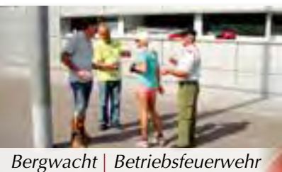
Bergwacht | Betriebsfeuerwehr