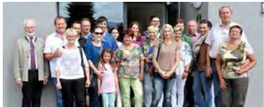
die neuen Mieterinnen und Mieter vor ihrem Wohnhaus

Das Gebäude wurde in Holzbau-Niedrigstenergiebauweise errichtet. Die 2- und 3-Zimmer-Wohnungen verfügen alle über