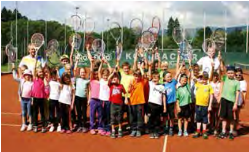
Tenniskurse in den Sommerferien

Ein Riesenerfolg waren heuer auch die Tenniskurse in den Sommerferien für die ganz „Kleinen“. Über 50 Kinder nahmen daran teil und es waren einige Supertalente darunter - somit hat der Klub keine Nachwuchssorgen. Im Oktober beginnt das Tennistraining in der Mürzer Tennishalle und wer Interesse hat kann sich noch anmelden, Tel.: Kurt Wutzl 0664 / 7672702