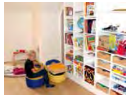
eigener Spiel- und Entspannungsraum