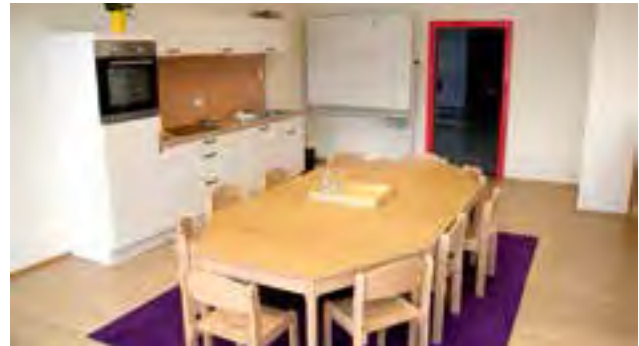
Teeküche und Essbereich

In der Volksschule Krieglach musste aufgrund der äußerst positiven Entwicklung der Schülerzahlen ein weiteres Klassenzimmer bereitgestellt werden, da im heurigen Schuljahr wegen der hohen Anzahl an „Tafelklasslern“ drei erste Klassen benötigt werden. Dadurch war das Klassenzimmer, in dem bis jetzt die Nachmittagsbetreuung untergebracht war, für diese Nutzung nicht mehr verfügbar. Deshalb wurde nun im zweiten Obergeschoß aus einem sporadisch genutzten Raum ein wunderbares Klassenzimmer mit Teeküche und entsprechende Nebenräume als Aufenthaltsbereiche für die Nachmittagsbetreuung geschaffen. Die außerschuli-