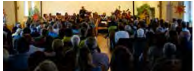
gut besuchtes Konzert im Pfarrsaal