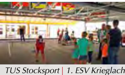
TUS Stocksport | 1. ESV Krieglach