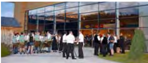
gute Stimmung im VAZ sowie im angrenzenden Freibereich