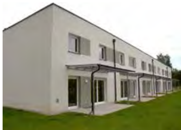
29 Wohneinheiten am ehemaligen Volkshausplatz wurden an die Mieter übergeben