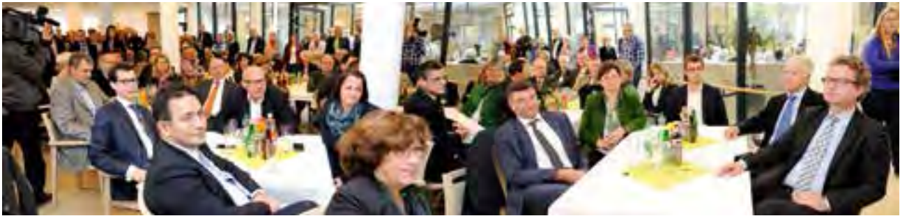
viele Ehrengäste folgten der Einladung des Sozialhilfeverbandes

In diesem Sinne – in Vertretung aller Beteiligten – ein spezielles DANKESCHÖN an alle, die dieses Vorzeigeprojekt möglich gemacht haben: