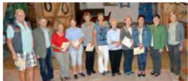
Ehrung der Landespreisträger