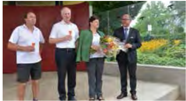
Begrüßung durch den Bürgermeister und den Tourismusobmann in Laßnitzhöhe