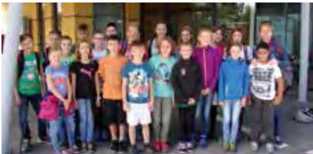
Treffpunkt beim Gemeindeamt

mittlerweile gut gediehen und darf mit Stolz berichtet werden, dass dieses Projekt des Krieglacher Kindergemeinderates voll und ganz gelungen ist.