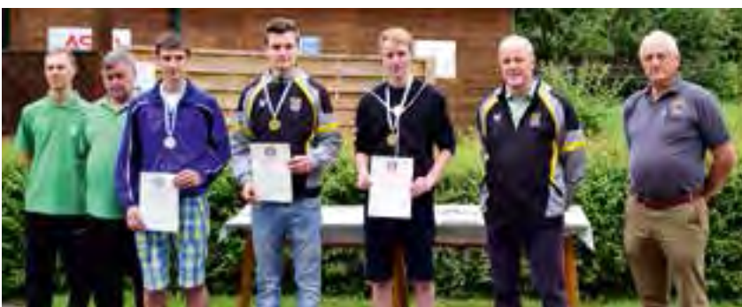
Siegerehrung 100m 40 Schuss Stehend