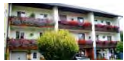
Rainhofsiedlung 9, 11, 13

Die Marktgemeinde Krieglach gratuliert herzlich