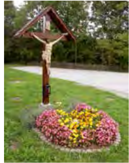
saniertes Wegkreuz im Hammerpark

Wir freuen uns, dass dieses Kreuz wieder im neuen Glanz erstrahlt und so wie in Vergangenheit und Gegenwart auch in Zukunft wieder seiner Funktion als Ort der Andacht gerecht wird.