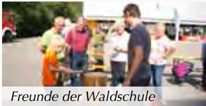
Freunde der Waldschule