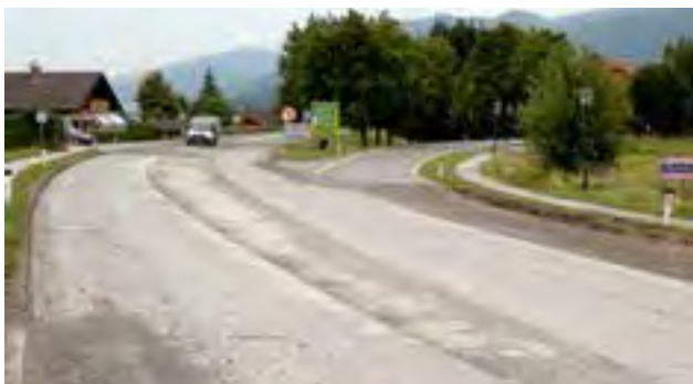
Sanierung des Untergrundes