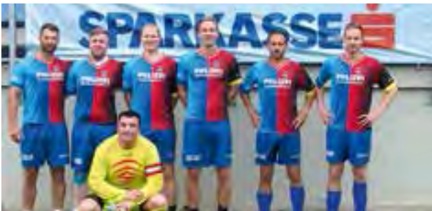
das Polizei-Fußballteam Bruck-Mürzzuschlag