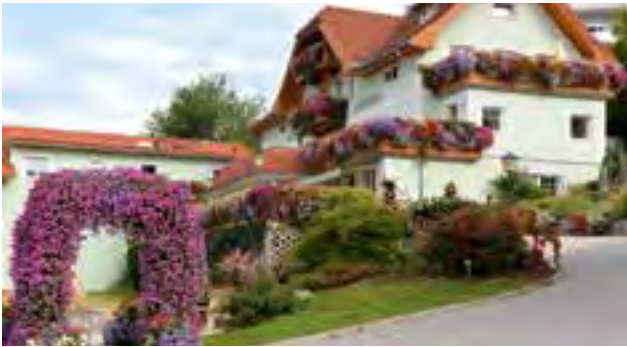
Pension Luisenheim in Laßnitzhöhe