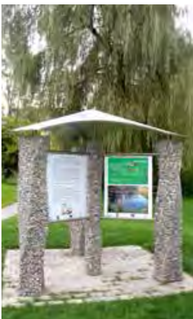
Info-Pavillon beim Biotop

Wir würden uns freuen, viele interessierte Wanderer begrüßen zu dürfen.