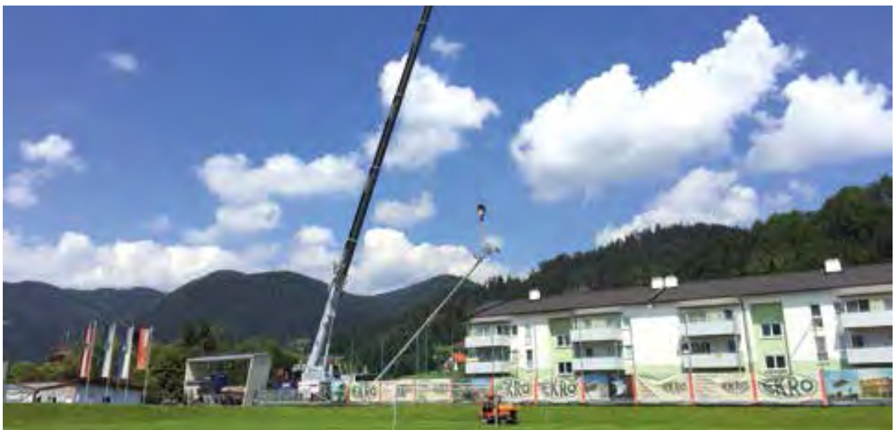
Aufstellen der Beleuchtungsmasten mit einem Spezialkran

Stadtwerke Mürzzuschlag war bereits beim Bau der Sporthalle für die elektrische Ausstattung verantwortlich und wurde nun die neue Flutlichtanlage in das bestehende Steuerungssystem eingebunden, sodass alle Abläufe perfekt zusammenspielen. Die Kosten für die Flutlichtanlage inklusive Erdbewegung und Betonarbeiten, die zur Gänze von der Marktgemeinde Krieglach getragen wurden, betragen rund € 70.000,-.