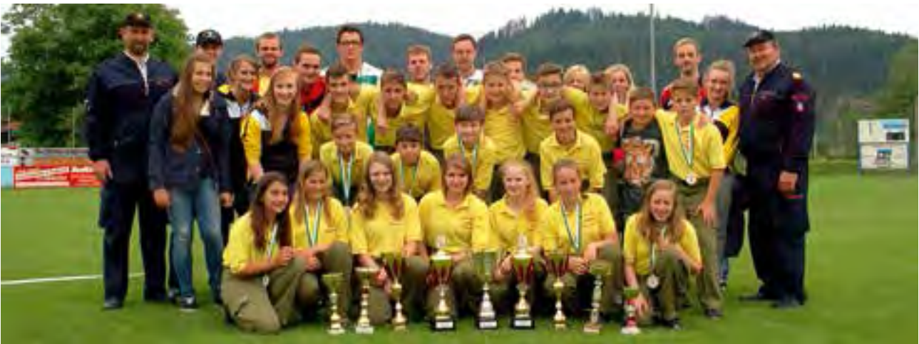
die erfolgreichen Bewerbungsgruppen der FF-Freßnitz

Der Höhepunkt im heurigen Bewerbungsgeschehen war der 50. Landesfeuerwehrleistungsbewerb am 20. und 21. Juni in Krieglach. Alle drei Gruppen nahmen daran aktiv teil und erzielten Spitzenergebnisse. Die Wettkampfgruppe schaffte es im Bronze- sowie im Silber-Durchgang den 9. Platz von 143 Gruppen zu erkämpfen. Auch die Damengruppe und die Bewerbungsgruppe können stolz auf ihre Platzierungen sein. Die Damen sicherten sich in Bronze den 88. und in Silber den 46. Rang. Die Bewerbungsgruppe konnte in Bronze den 39. und in Silber den 49. Platz erreichen.