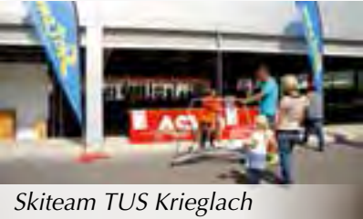
Skiteam TUS Krieglach