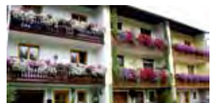
Rainhofsiedlung 3, 5, 7