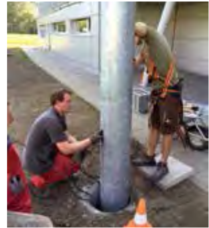
Installationsarbeiten bei den Flutlichtmasten

Nach dem Kunstrasenplatz, der bereits seit der Inbetriebnahme im Jahr 2010 über eine moderne, leistungsstarke Flutlichtanlage verfügt, wurde nun auch das Hauptfeld bzw. der Naturrasenplatz mit einer Flutlichtanlage ausgestattet. Auf den insgesamt vier Masten befinden sich je sechs Planflächenstrahler, also insgesamt 24 leistungsstarke Beleuchtungskörper, die den gesamten Naturrasenplatz hervorragend ausleuchten.