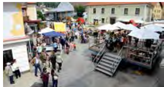
buntes Rahmenprogramm auf der Bühne am Hauptplatz