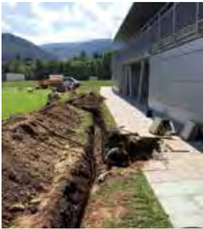
Verlegung der Kabel