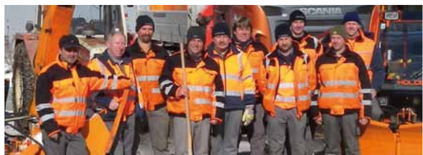
Winterdienst-Team des Gemeindebauhofes

Den Mitarbeitern des Gemeindebauhofes darf für ihren Einsatz Lob und Anerkennung ausgesprochen werden.