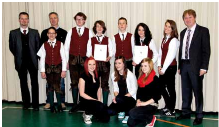
die PreisträgerInnen mit ihren Lehrern bei der Urkundenverleihung

Herzliche Gratulation an die jungen Künstler! Das allgemein sehr hohe Niveau dieses Wettbewerbes in Mitterdorf i.M. bestätigte die gute Arbeit unserer Musikschule in Krieglach und ihrer LehrerInnen - die Blasmusik darf sich also über guten Nachwuchs freuen!