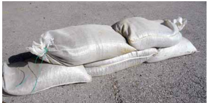
Sandsäcke bieten einen schnellen und wirksamen Schutz

lach 03855/2355-0 Kontakt auf – wir unterstützen Sie gerne.