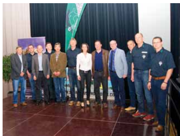
Vortragende und Funktionäre