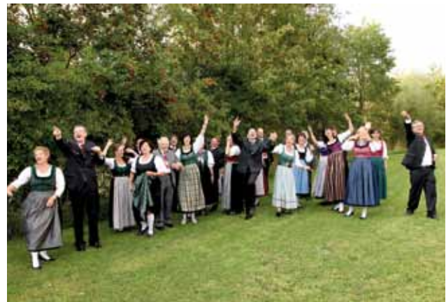
„krieglach vocal“ als lustige Leute‘