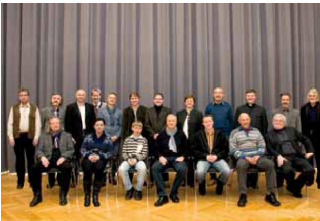
Projektteam „Rosegger Live 2012“