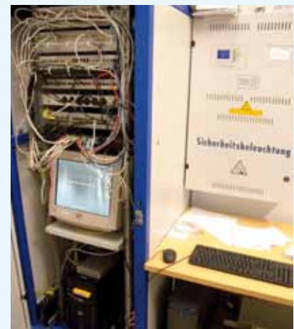
Serverraum im Gemeindeamt

Plänen und die Verarbeitung von digitalen Fotos erfordert einen guten Arbeitsspeicher und entsprechende Speicherkapazitäten auf der Festplatte bzw. auf einer externen Speicherhardware. Somit verfügt die Gemeindeverwaltung über moderne Computeranlagen zur Bewerkstelligung der täglichen Aufgaben.