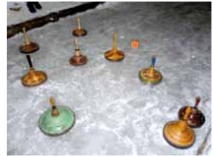
Dreiländer-Eisschießen in Mürzzuschlag

Am Samstag versammelten sich einige Mitglieder in der Brucker Forstschule, um ihr Wissen ein wenig auf zu frisken. Bei Small Talk oder Rhetorik für Fortgeschrittene wurde diskutiert, gelacht, geredet und dabei noch viel dazu gelernt. Es gibt über das ganze Jahr verteilt viele Bildungsangebote, die von unseren Mitgliedern mit Begeisterung genutzt werden. Der gelungene Abschluss je-