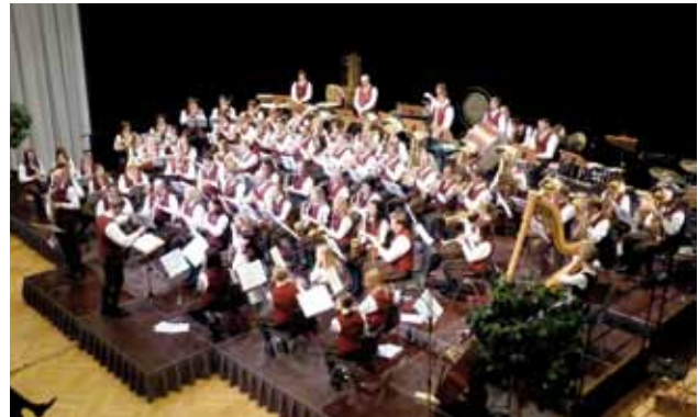
Musikkapelle Krieglach in symphonischer Besetzung