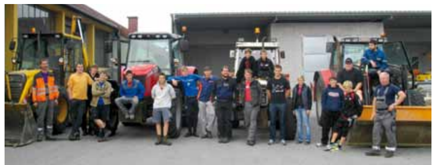
Projektstart - 30 Stunden für meine Gemeinde

strengenden, aber sehr lustigen Tag traten wir um ca. 20 Uhr die Heimreise an.