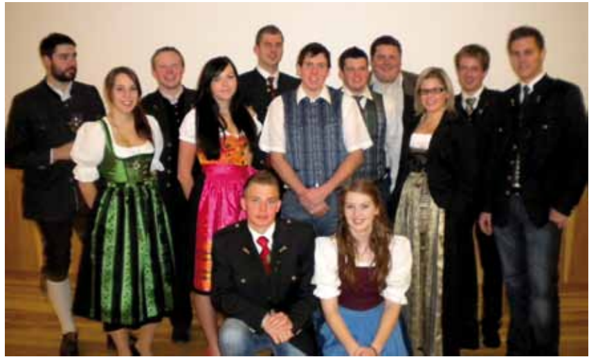
der neu gewählte Vorstand der Landjugend Krieglach