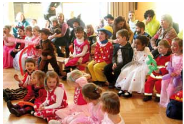
Kasperltheater im kleinen Saal