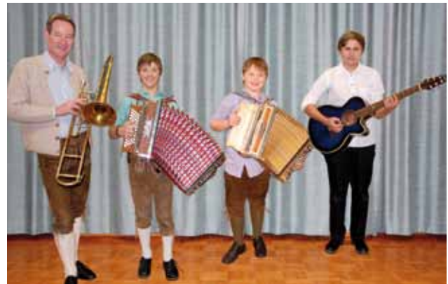
Volksmusikensemble der Musikschule Krieglach