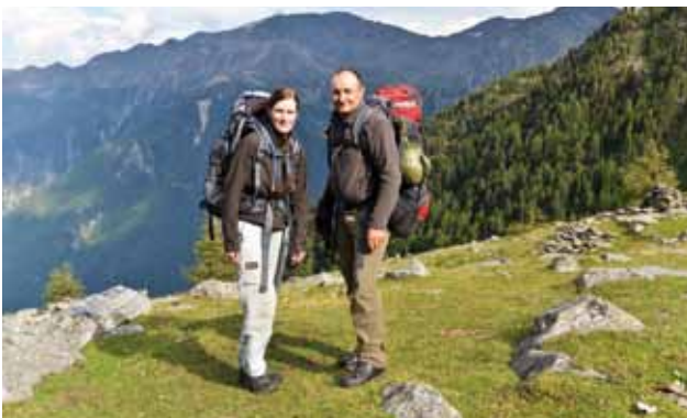
zu Fuß durch die Alpen...

Nach insgesamt 85 Tagen, 1000 km und 73.000 Höhenmetern wurde das Matterhorn erreicht und ein großer Traum war in Erfüllung gegangen.