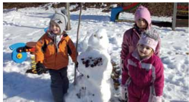
Schneemannbauen im Garten