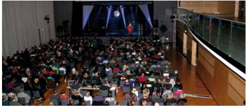
über 600 Besucher im VAZ Krieglach

Über 600 Gäste aus Nah und Fern ließen sich den Streifzug durch die erfolgreichsten Musicals, wie „Der König der Löwen“, „Mamma Mia“, „Romeo und Julia“, „We Will Rock You“, „Das Phantom der Oper“, „Cats“, „Die Rocky Horror Show“, „Elisabeth“, „Mozart!“, die „West Side Story“ und das Hippie-Musical „Hair“ nicht entgehen. Neben den Stars aus