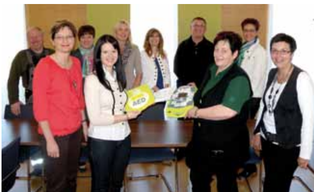
die geschulten MitarbeiterInnen

Wir hoffen zwar nicht, dass wir den DEFI einsetzen müssen, jedoch kann dieser im Ernstfall Menschenleben retten.