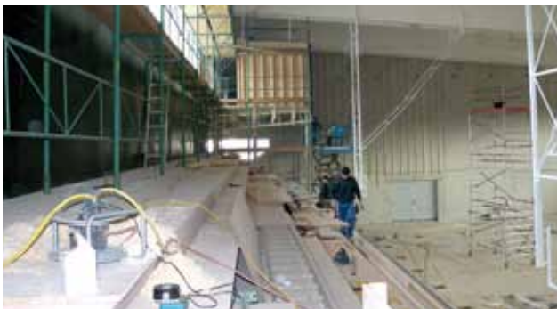
Aufbau der Besuchertribüne

Aktuelle Bilder über den Baufortschritt können Sie im Infokanal oder auf unserer Homepage www.krieglach.at sehen.