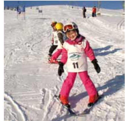
Skirennen beim Lammer

In der Faschingszeit durften die Kinder zwei große Feste erleben. Bei der Pyjamaparty kamen die Kinder im Pyjama und „unrasiert“ in den Kindergarten. Sie hatten die Möglichkeit den Tag mit Kipferl und Kakao zu beginnen, sich dort zu rasieren, ein Fußbad zu nehmen, eine „Gute-Nacht-Geschichte“ zu hören, einfach weiter zu schlafen oder im Snoezelenraum diverse Sinnesspiele zu genießen. Die Lebhaften tobten sich bei einer Polsterschlacht aus. Das große Faschingsfest war besonders aufregend und turbulent. Verkleidet und mit Luftschlangen gewappnet, stürzten sich die Kinder in den Stationenbetrieb. In den Gruppenräumen und der Halle durften die Kinder Dosen