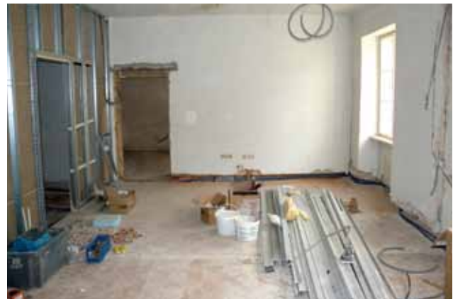
Einbau der Sanitäreinheiten