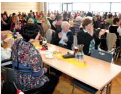
guter Besuch trotz starkem Schneefall

Bei flotter Musik und guter Stimmung wurde ausgiebig getanzt und gefeiert.