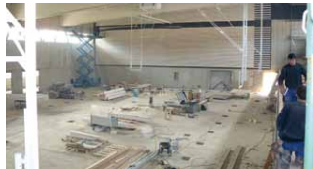
Montage der Akustikpaneele