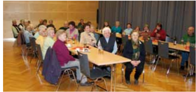
Lesung im Rahmen des Pensionistennachmittages