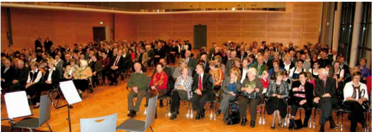
das Publikum genoss den musikalischen Start ins Jahr 2012

Die Vorfreude auf das Neujahrskonzert 2013 kann beginnen!