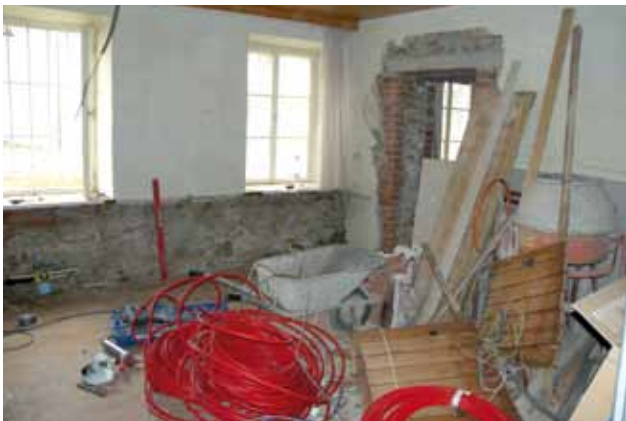
Erneuerung sämtlicher Leitungen

(Wasser-, Kanal- und Stromleitungen) wurde entfernt und entsprechend dem Baufortschritt erneuert. Schrittweise wird das ehemalige Gemeindeamt zu einem dem heutigen Standard entsprechenden Wohngebäude umgebaut, ohne sein einzigartiges äußeres Erscheinungsbild zu verlieren.