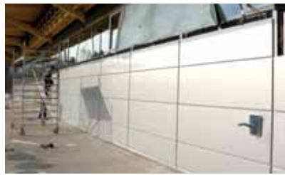
Montage der Außenverkleidung

Nachdem im Herbst/Winter 2011 der Baufortschritt bei unserer Sporthalle optimal verlief, konnte in den Wintermonaten der Innenausbau fortgesetzt werden. Die Glaselemente und Fenster wurden eingesetzt, die Außenfassade gedämmt und die Metallpaneele angebracht. Im Innenbereich wurde neben den Installationsarbeiten für die Heizung, Lüftung und die Sanitärbereiche bereits der Großteil der Fliesenlegerarbeiten abgeschlossen. Die Saalverkleidung, die für ein gutes Raumklima und eine gute Akustik sorgen wird, konnte ebenfalls bereits montiert werden. Der Bauzeitplan sieht im Weiteren vor, dass nach dem Versetzen der Türen der Hallenboden verlegt wird, sodass mit den abschließenden Arbeiten, wie dem Montieren der Trennvorhänge und vielen kleineren Arbeiten wie