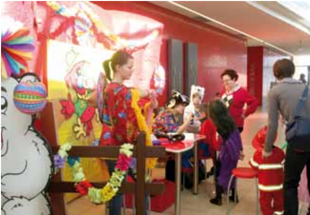
Kinderschminken und lustige Ballontiere im Foyer