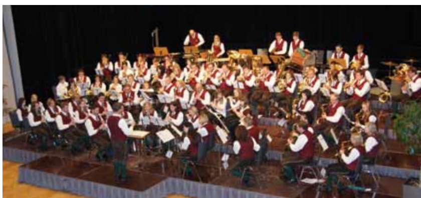
Musikkapelle voestalpine Roseggerheimat Krieglach