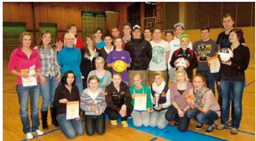
die erfolgreichen Mannschaften der Landjugend Krieglach