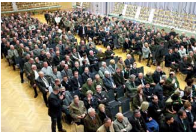
viele JägerInnen informierten sich beim Bezirksjägertag