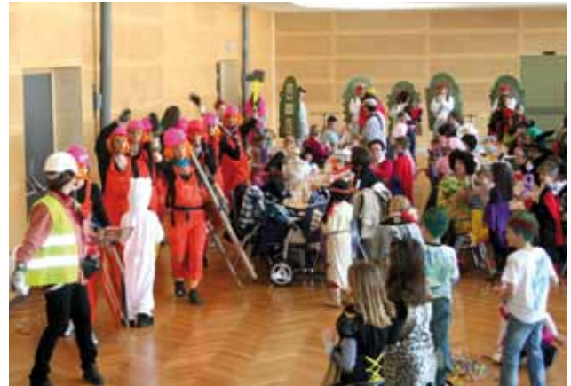
Einzug der Masken

Am Faschingsdienstag lud die Marktgemeinde Krieglach zu einer Party ins Krieglacher Veranstaltungszentrum ein, um gemeinsam den Faschingsausklang zu feiern.