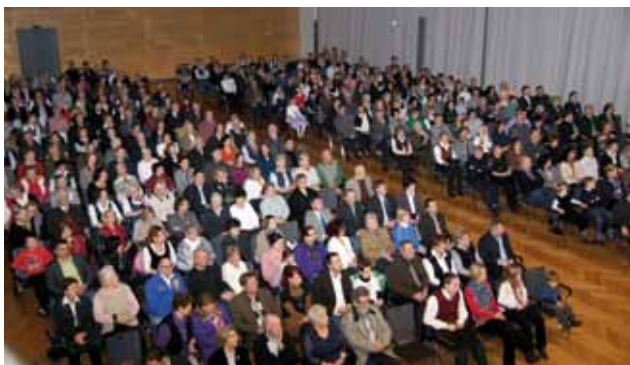
über 400 Gäste beim Stefanikonzert

Nach dem Konzert genossen die Konzertgäste das angenehme Ambiente im Foyer des VAZ Krieglach, wo man steirische Weine der Weinkellerei Herbert Strauss verkosten konnte.