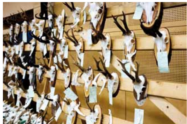
Präsentation der überprüften und bewerteten Trophäen