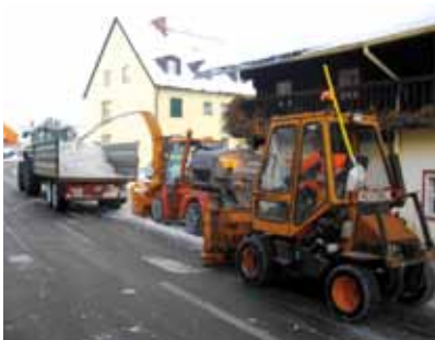
Schneetransport im Zentrum