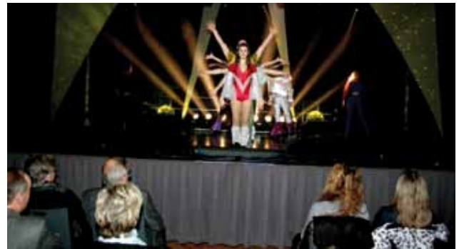
großartige musikalische Interpretation und effektvolle Bühnenshow