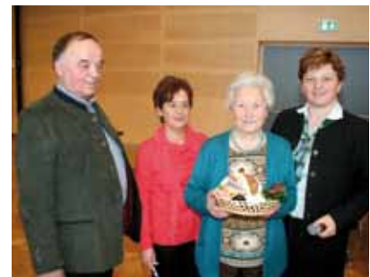
Überreichung der verlosteten Warenpreise