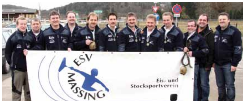
die Fangruppe bei der ASKÖ-Bundesmeisterschaft in Gmunden (OÖ)

Ein kräftiges Stock Heil wünscht der ESV Massing.