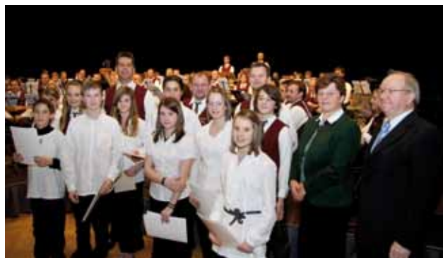
Angelobung der JungmusikerInnen