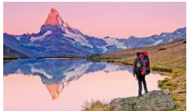
...bis zum Matterhorn