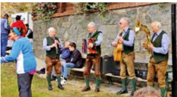
musikalische Umrahmung durch die Geyregger Musikanten