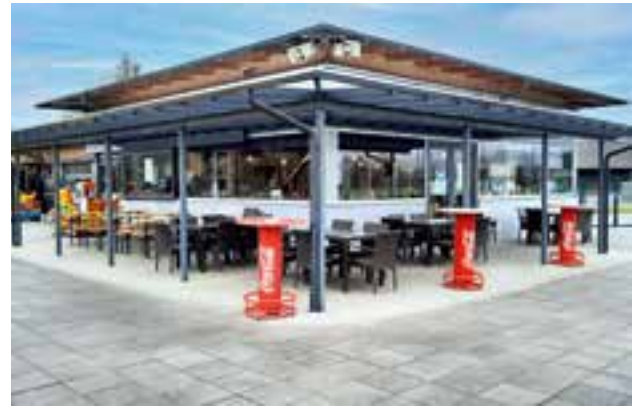
Erneuerung der Überdachung der Seeterrasse beim Seegasthaus

Beim Fluderstüberl auf der Jugend- und Familienfreizeitanlage wurde ebenfalls die Eingangstür erneuert. Damit diese in Zukunft besser geschützt ist, wurde ein Vordach angebracht. Diese Arbeiten stellen eine Investitionssumme in der Höhe von rd. € 6.500,00 dar.