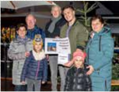
der Gewinner des Hauptpreises mit den GlücksegerInn sowie den Mitgliedern des Gemeindevorstandes