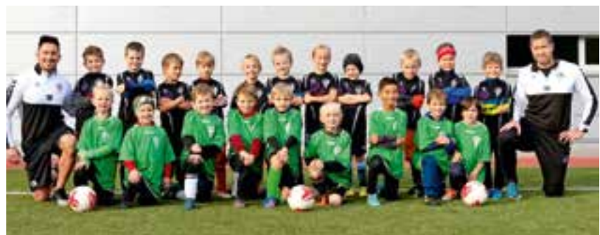
U7 und U8

Der Abstand zum Mittelfeld beträgt jedoch nur sechs Punkte. Mit einer guten Vorbereitung (Trainingsstart: 16. Jänner 2023) ist sicher noch einiges drinnen.