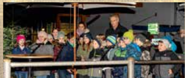
Beiträge der Volksschule Krieglach