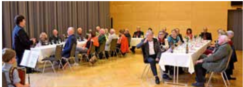
Jubilarfeier im Oktober

Die Gemeindegratulationen, die ab dem 75. Geburtstag bzw. ab der Goldenen Hochzeit in Form monatlicher gemeinsamer Jubilarfeiern im Veranstaltungszentrum Krieglach stattfinden, erfreuen sich großer Beliebtheit und konnten zur Freude der Jubilare und der Gemeindevertreter, wieder in gewohnter Weise durchgeführt werden.