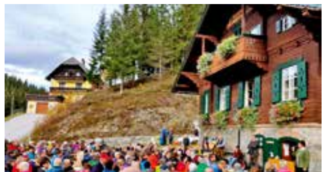
zahlreiche Gäste nahmen am Familienwandertag und beim Festakt 120 Jahre Waldschule teil