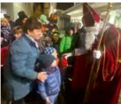
der Nikolaus brachte traditionelle Krampussackerl für die Kinder

Sie alle tragen Jahr für Jahr zum Gelingen dieser Aktion bei!