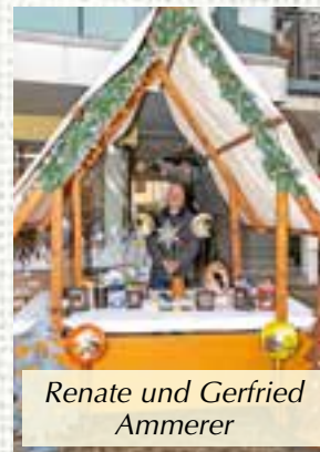
Renate und Gerfried Ammerer