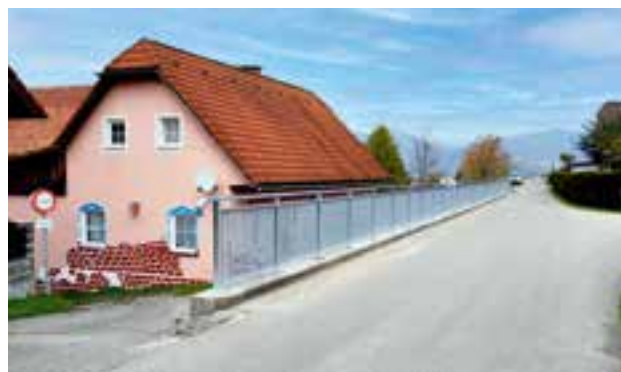
Montage des neuen Geländers entlang des Postmühlwegs

Die Kontrolle der Straßen, Brücken und Geländer gehört zu den ständigen Aufgaben einer Gemeinde.