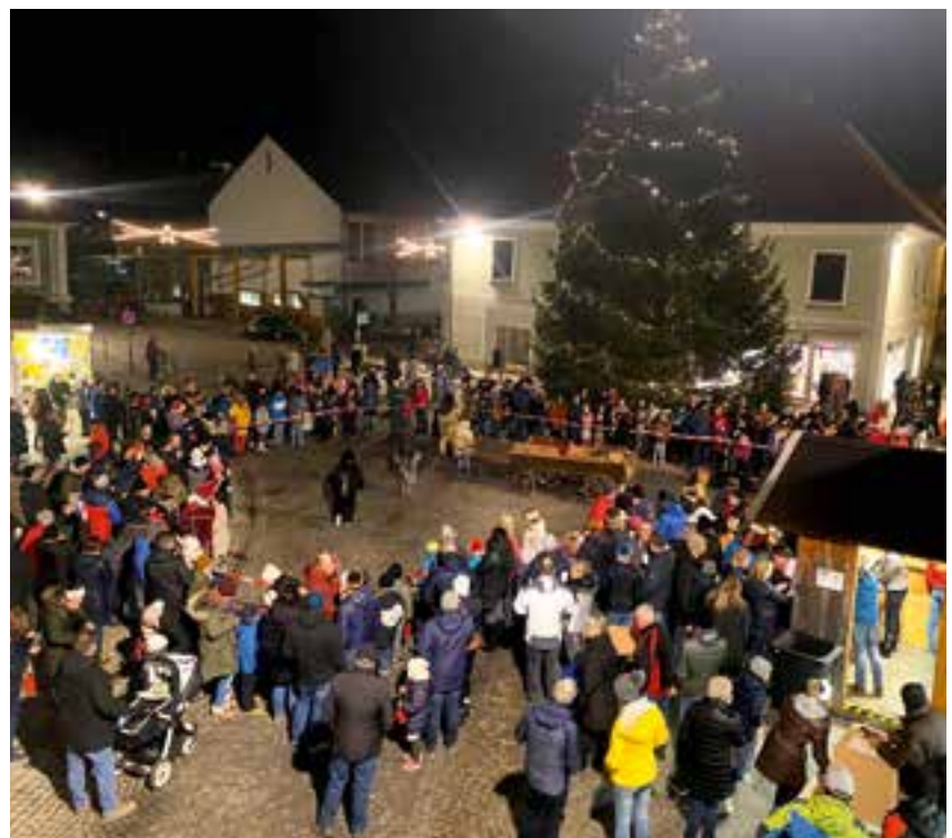
viele Gäste konnten am Krieglacher Hauptplatz begrüßt werden