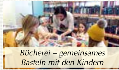
Bücherei – gemeinsames Basteln mit den Kindern