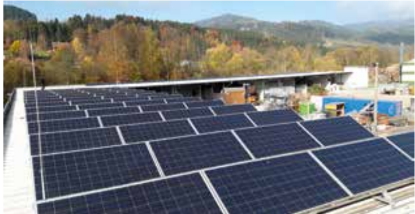
bestehende Photovoltaikanlage am Dach des Bauhofs

Wenn die Voraussetzungen für eine Erweiterung der Photovoltaikanlagen der Marktgemeinde Krieglach vorliegen, wird die Gemeinde im Rahmen dieses Prozesses die Produktion von Strom mit der Sonne bestmöglichst nützen. In weiterer