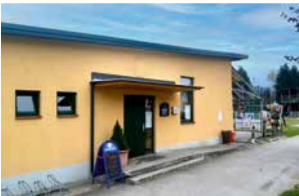
neues Vordach und neue Eingangstür für das Fluderstüberl

Wir legen großen Wert darauf, dass unsere Gebäude stets in gutem Zustand erhalten bleiben.