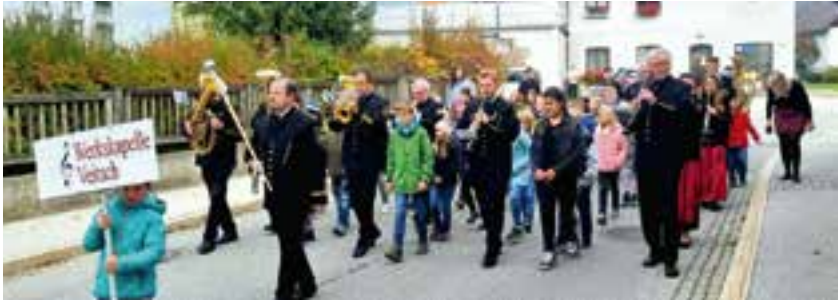
gemeinsame Marschprobe beim Aktionstag in der Veitsch

Probedirigieren, Instrumentenrätsel und eine gemeinsame Marschprobe machten den Kindern großen Spaß und weckten großes Interesse am Musizieren.