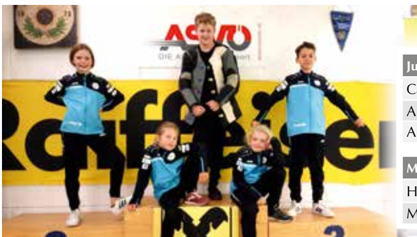
Training für unsere Jugend in Knittelfeld

Der SV Krieglach hat sich auch dieses Jahr wieder vorgenommen, einige Starter für die österreichische Staatsmeisterschaft und österreichische Meisterschaften zu stellen. Dafür haben sich fünf Krieglacher Schützen am 12. November auf den Weg zum Schützenverein Bärnbach gemacht, wo die erste Qualifikation für die „stehend frei Klassen“ stattgefunden hat. Mit durchwegs guten Ergebnissen sieht es derzeit für eine Beteiligung an den Staatsmeisterschaften für den SV Krieglach sehr gut aus.