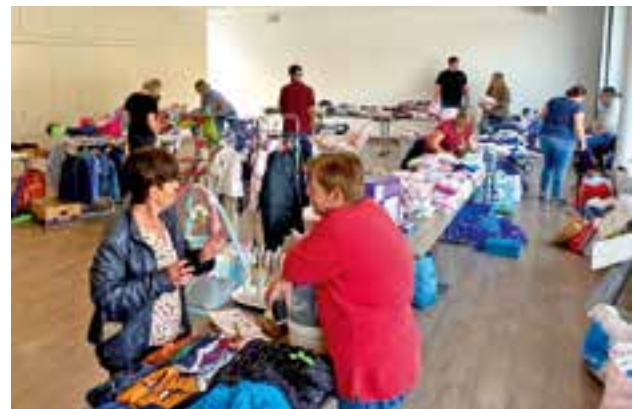
über 20 Stationen standen zum Stöbern zur Verfügung