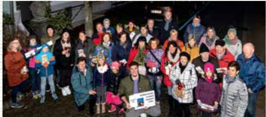
die glücklichen Gewinner mit den Gemeindevertretern

GK Elviera Königshofer an die glücklichen Gewinner überreicht werden. Gleich im Anschluss an die Verlosung der Gutscheine der Gewerbetreibenden fand die