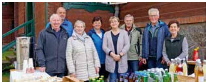
ein herzliches Danke den fleißigen Helfern

Dieser Wandertag am Nationalfeiertag, wird auch im nächsten Jahr, am Donnerstag, dem 26. Oktober 2023 wieder stattfinden. Wir freuen uns auf eine rege Teilnahme.