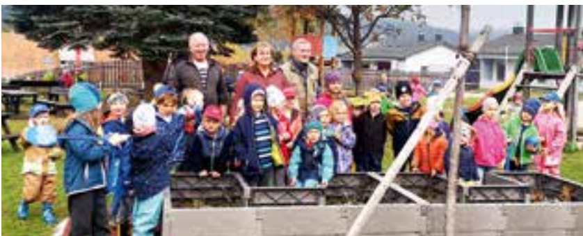
das Hochbeet wurde gemeinsam mit den Kindern aufgestellt