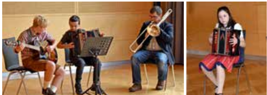
musikalische Umrahmung der Jubilarfeier im Oktober

Alle anwesenden Jubilare freuten sich, wieder in Gesellschaft zu sein und so konnte der Kontakt unter den Geburtstags- bzw. Ehejubilaren oft nach sehr langer Zeit wiederhergestellt und die Gemeinschaft gefördert werden.