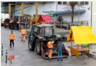
Vorbereitungsarbeiten durch die Mitarbeiter des Bauhofs der Marktgemeinde Krieglach