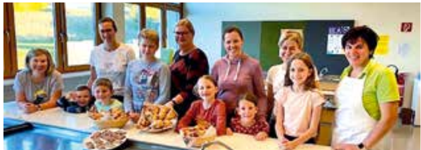
die Teilnehmerinnen beim Eltern-Kind-Backkurs am 4. Oktober

Mittelschule angeboten: Der Unkostenbeitrag für Erwachsene beträgt € 5,00/Person und die Teilnehmeranzahl ist mit 14 Personen begrenzt. Anmeldungen werden gerne in der Verwaltung der Marktgemeinde Krieglach unter 03855/2355-0 bzw. gde@krieglach.gv.at entgegengenommen.