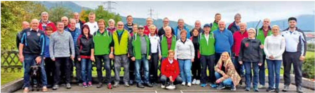
die Teilnehmer an der Vereinsmeisterschaft 2022

Nachdem im Jahr 2022 sehr viele Turniere bestritten wurden, veranstaltete der 1. ESV Krieglach zum Abschluss, am Samstag, dem 1. Oktober das jährliche, interne Stocksportturnier. Trotz wechselhaftem