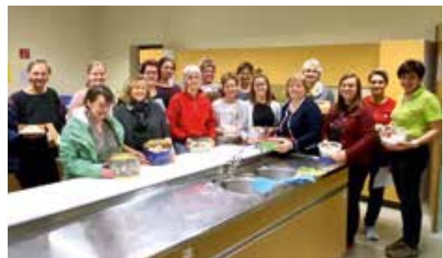
Teilnehmerinnen am Backkurs – 29. November