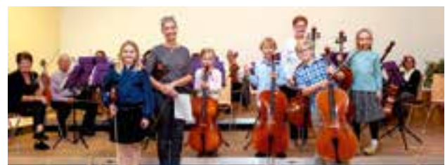
Auftritt der „Kleinen Streicher“