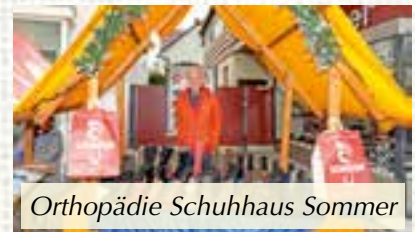
Orthopädie Schuhhaus Sommer