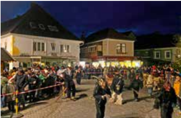
Krampustreiben am Hauptplatz