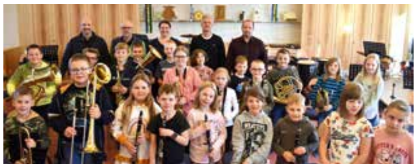
Music Together St. Kathrein a. H.