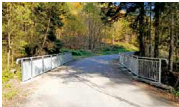
bei der Steinbachbrücke wurde ebenfalls ein neues Geländer montiert