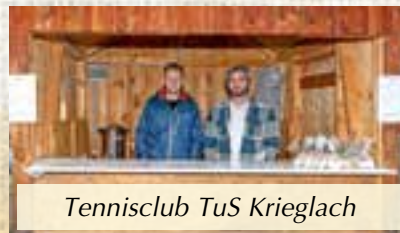
Tennisclub TuS Krieglach