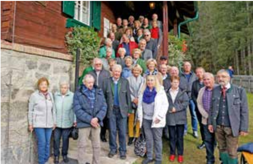
im Rahmen des Festaktes fand auch das Treffen der ehemaligen Waldschüler statt