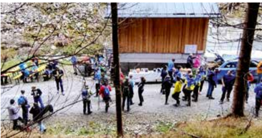
Labestation Kraftwerk Freßnitzbach