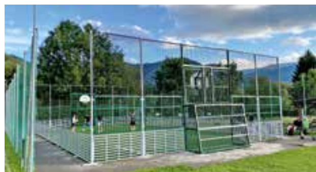
der neue Funcourt erfreut sich bereits großer Beliebtheit