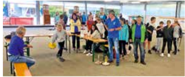
1. ESV Krieglach