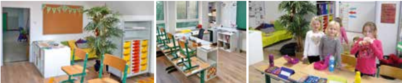
Adaptierung einer neuen Schulklasse in der Volksschule

Auch in diesem Sommer hat die Marktgemeinde Krieglach in den Krieglacher Schulen umfangreiche Investitionen vorgenommen. Sehr erfreulich ist, dass auch im heurigen Schuljahr drei erste Klassen geführt werden . Aus diesem Grund war es erforderlich ein zusätzliches Klassenzimmer zu adaptieren. Der ehemalige Computerraum im Dachgeschoß, der aufgrund des digitalen Unterrichts nicht mehr benötigt wird, wurde von Grund auf saniert und zu einem modernen Klassenzimmer umgebaut. Dieses Klassenzimmer wurde, wie alle anderen auch, mit einer interaktiven Schultafel , so genannten Whiteboards, ausgestattet. Aus dem Computerraum entstand eine helle, lichtdurchflutete und freundliche Klasse für die Jüngsten . Beim Volksschulgebäude wurde auf zwei Seiten die Außenbeschriftung angebracht. Die Entscheidung fiel auf Buchstaben aus Alu , die an der Außenwand angeschraubt wurden.