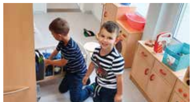
heller, freundlicher Gruppenraum