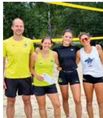
Platz 1 - „Oldies“