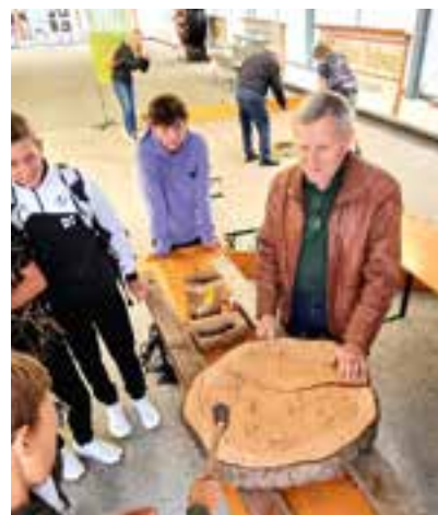
Freunde der Waldschule