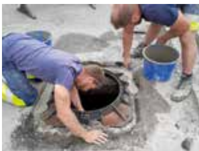
Sanierung der schadhaften Kanalschächte