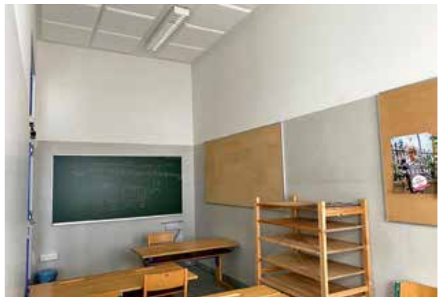
Anbringen einer Akustikdecke

Wir wünschen allen Schülern einen guten Start in das neue Schuljahr und viel Erfolg!