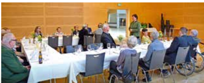
Jubilarfeier im September