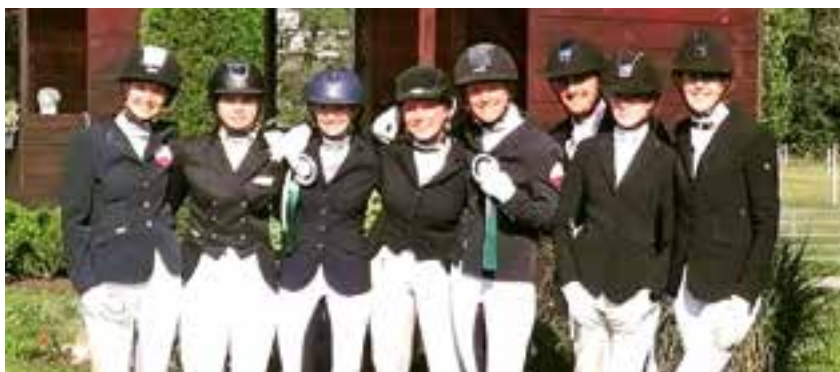
Team Rainhof bei den Landesmeisterschaften in Oisnitz