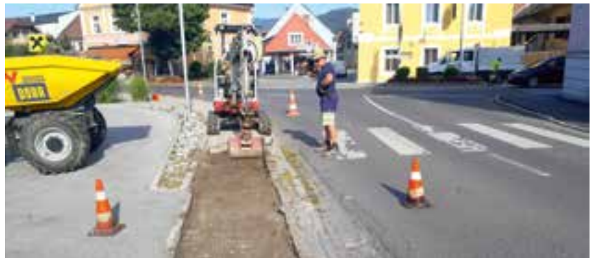
Sanierung der Randleisten

Diese Sanierung musste sehr schnell organisiert und durchgeführt werden, um in diesem Bereich die Sicherheit der Fußgänger zu gewährleisten.