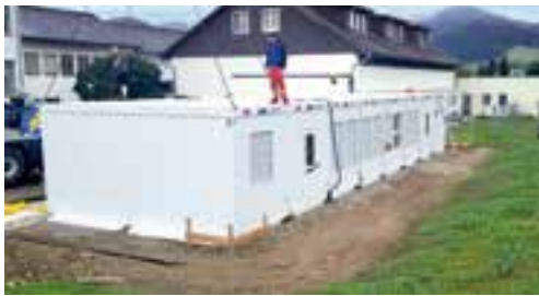
Errichtung der Dachkonstruktion