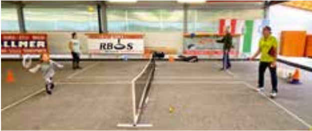
Tennisclub TUS Krieglach