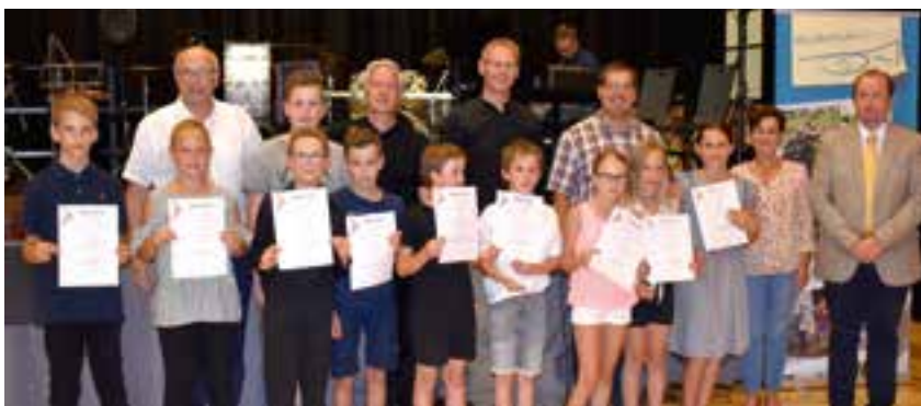
Jungmusiker-Leistungsabzeichen großes Schlusskonzert