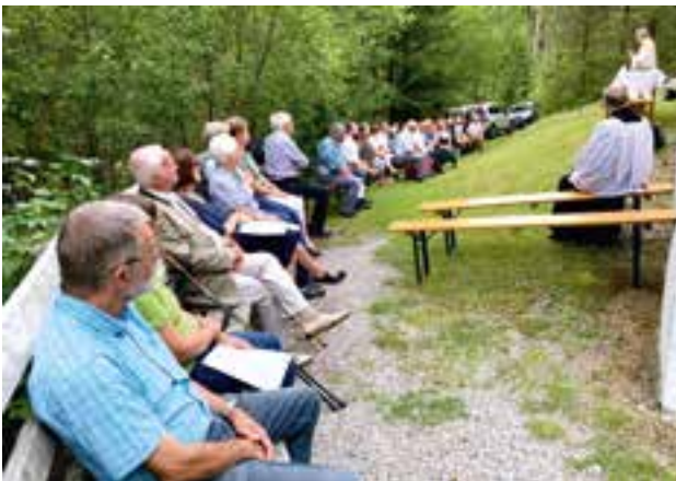
guter Besuch der Hl. Messe bei der Heldenkapelle

Bei einer Begegnung bei Brot und Wein, zu der die Marktgemeinde Krieglach eingeladen hatte, fand die Veranstaltung einen geselligen Abschluss.