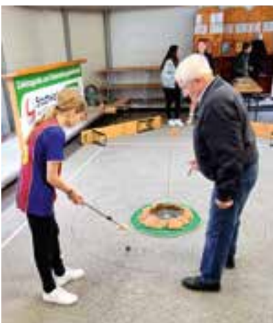
Freunde der Waldschule

Die Besucher zeigten großes Interesse und hatten großen Spaß mit dem Angebot der örtlichen Sportvereine bzw. Institutionen. So mancher Besucher, der noch keinem Krieglacher Verein angehört, könnte durch diese Veranstaltung zur Mitgliedschaft bzw. zur aktiven Vereinsarbeit in Krieglach bewegt worden sein. Für die Verpflegung der Gäste sorgte EKRO TUS Krieglach Fußball – Danke!