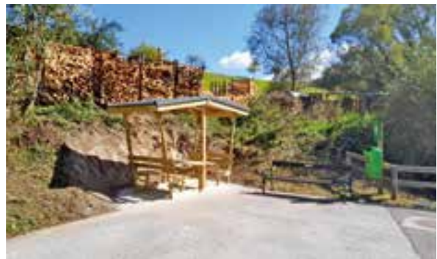
überdachte Sitzgarnitur in der Badgasse