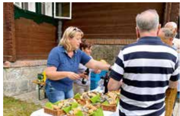
Bewirtung durch die Marktgemeinde Krieglach