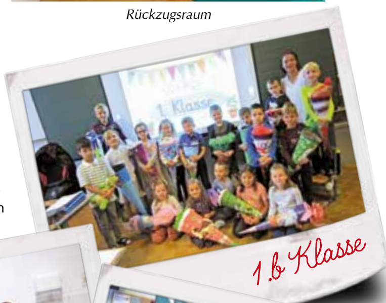
1. b Klasse

lungsreiche und lehrreiche Zeit verbringen werden.