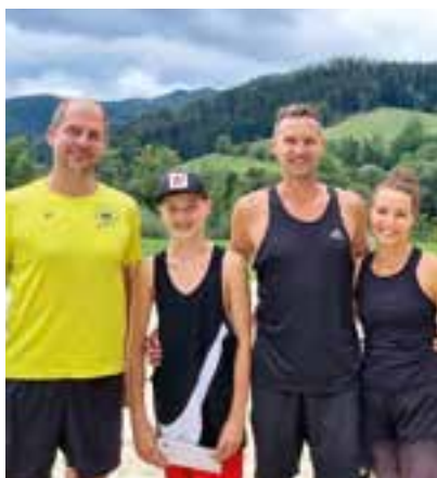
Platz 2 - „Polanzer“

Für die Idee, Organisation und tadellose Durchführung darf dem Obmann des Sportausschusses, Herrn GR Hubert Riegler herzlich gedankt werden.