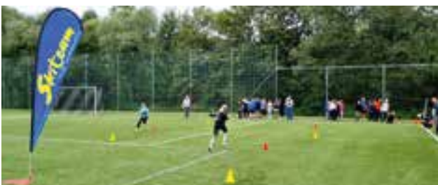
Skiteam TUS Krieglach