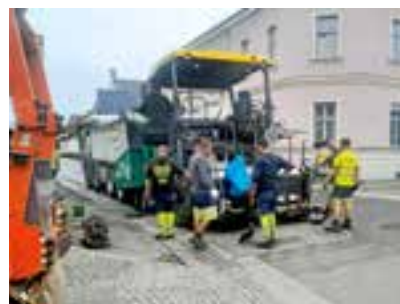
Beginn der Asphaltierungsarbeiten im Bereich Alplkreuzung