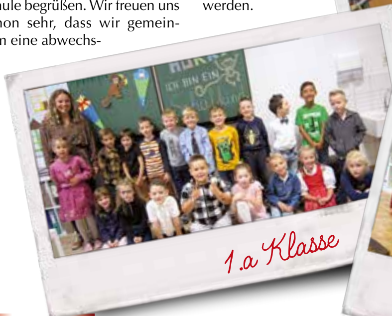
1. a Klasse