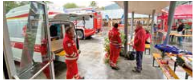
ÖRK – Ortsstelle Krieglach und FF Krieglach