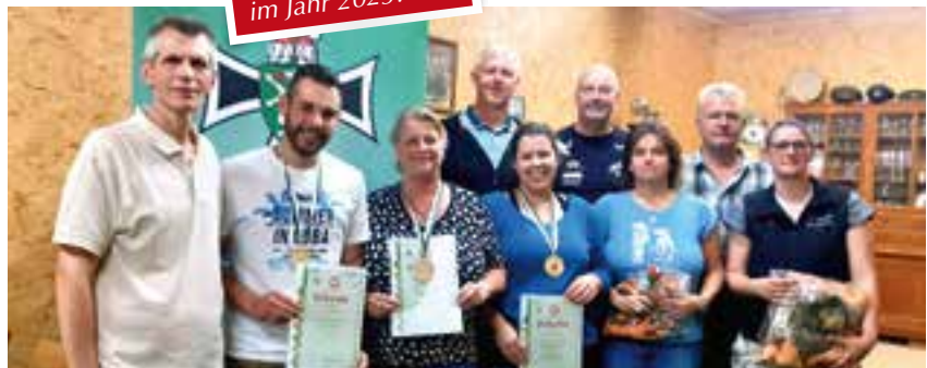
die glücklichen Gewinner mit den Gratulanten seitens der Marktgemeinde und des ÖKB

Wir freuen uns auf ein Wiedersehen im Jahr 2023!