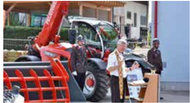
Segnung und offizielle Übergabe des Teleskopladers