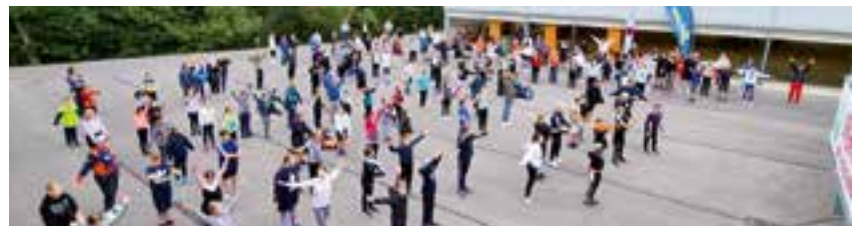
Krieglacher Vereine haben sich im Rahmen dieser Veranstaltung den Teilnehmern vorgestellt und Aktivitäten gesetzt – ein großes DANKE dafür!