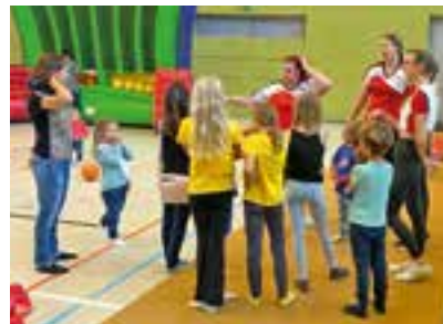
Cheerleaderverein DC Butterfly