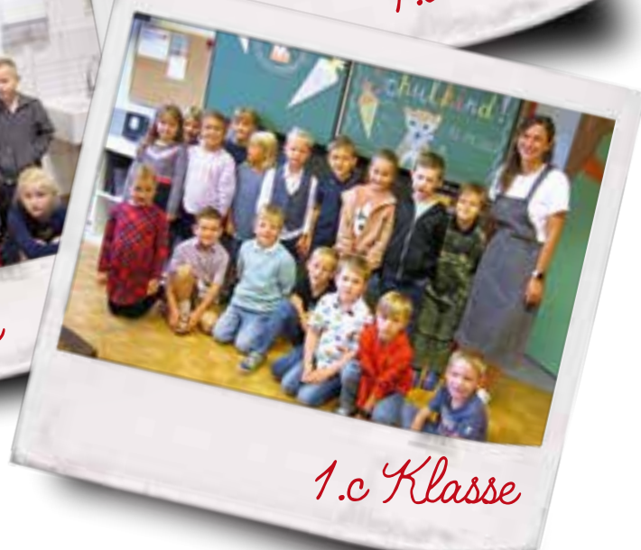
1. c Klasse