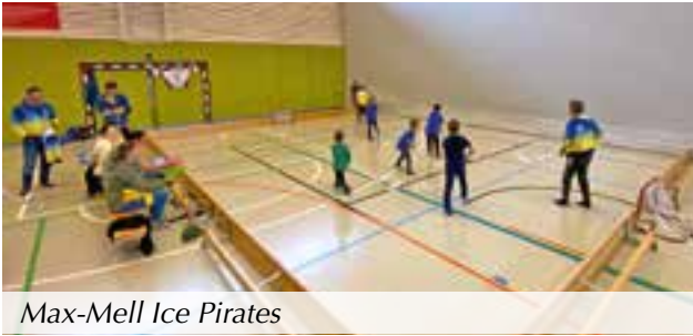
Max-Mell Ice Pirates