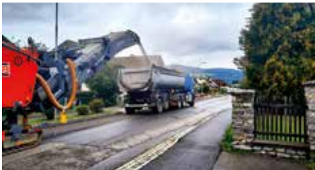
Abfräsen des alten Asphaltbelages

der Roseggerstraße beginnend von der Alplkreuzung bis zum Objekt Roseggerstraße 118 auf zwei Etappen eine neue 4 cm