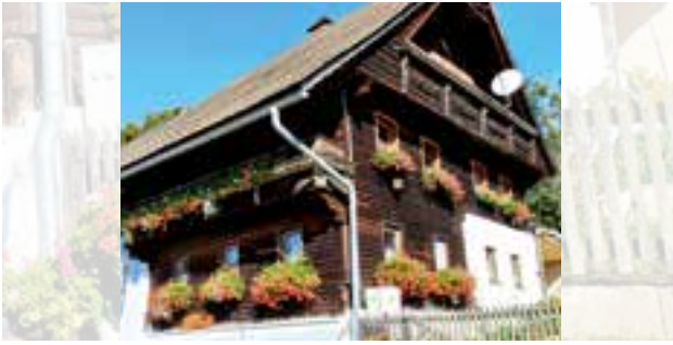
Familie Hörtnner vlg. Tösch