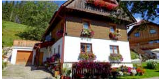
Familie Schwaiger vlg. Gregorbauer