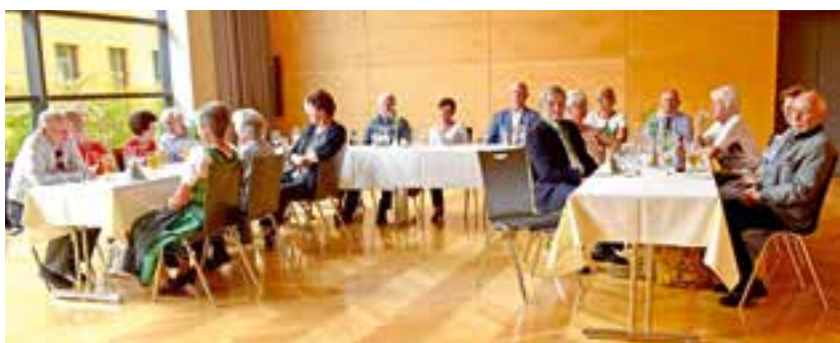
Jubilarfeier im August