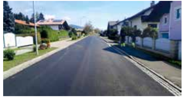
neu asphaltierte Roseggerstraße

starke Verschleißasphaltschicht aufgezogen. Wichtig war uns, dass der Arbeitsgang mit zwei Asphaltfertigern durchgeführt wurde, um eine Mittelnacht auf der Fahrbahn zu vermeiden . Im Vorfeld wurden noch Sanierungsarbeiten bei den Kanalschächten durchgeführt, um