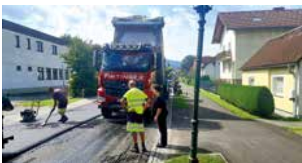
Aufbringen der neuen Asphaltenschicht mit zwei Fertigern – ohne Mittelnaht