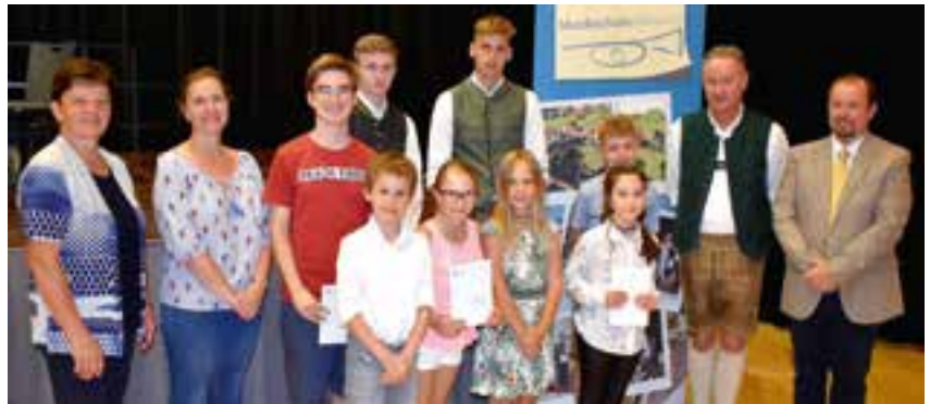
Preisträger der Wettbewerbe Solistenkonzert