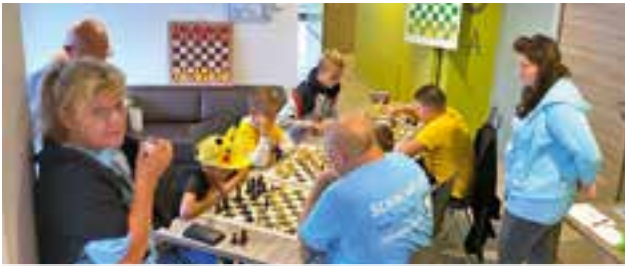
Schachklub Windheimat TuS Krieglach