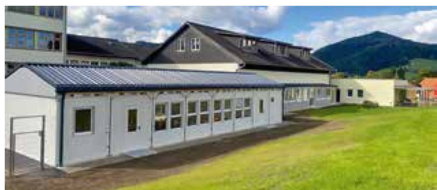
Außenansicht des neuen Kindergartenzubaus