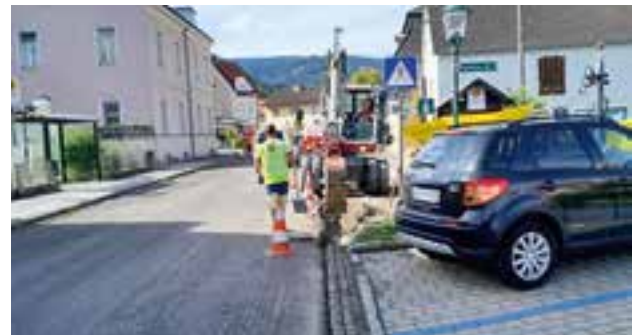
Sanierung der Randleisten