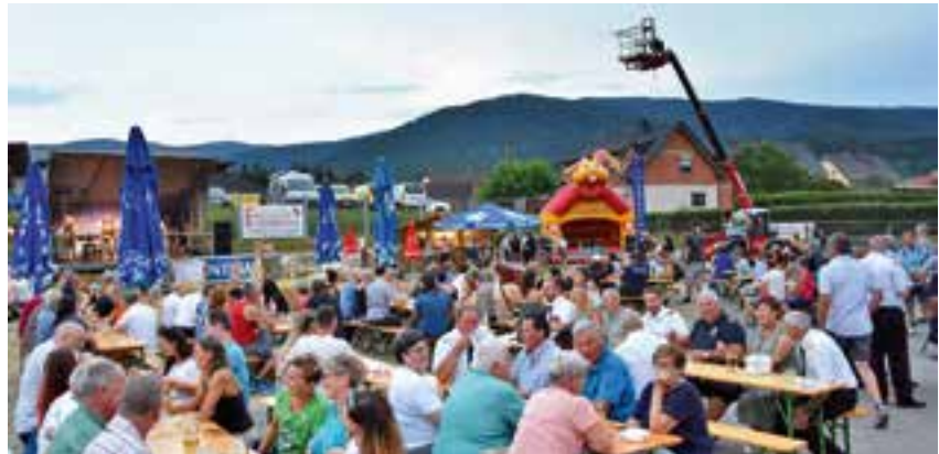
beste Stimmung beim Strohsitzerfest

Am Vorplatz des Rüsthauses standen den Besuchern Ausschank-Stände zur Verfügung.