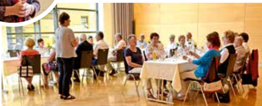
Jubilarfeier im Juli