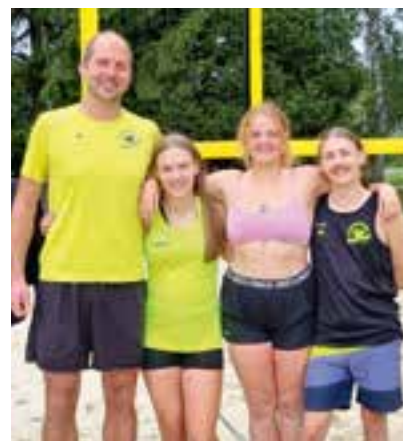
Platz 4 - „Ente“