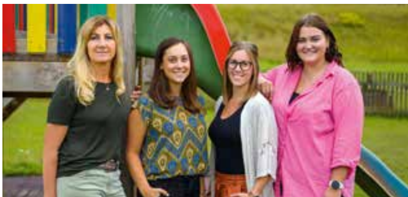
das Team des Heilpädagogischen Kindergartens

Um alle Kinder bestmöglich zu betreuen, kommen zusätzlich zum Kindergartenpersonal wö-