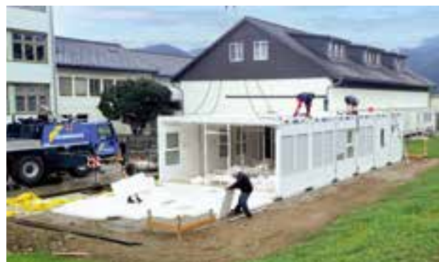
Anlieferung und Einheben der Fertigmodule