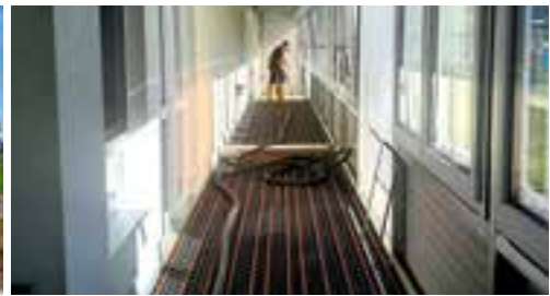
Verbindungsgang mit Fußbodenheizung

Für die Marktgemeinde Krieglach hätte keine Verpflichtung bestanden , eine Erweiterung des Gemeindecindergartens zu veranlassen, da nur für jene Kinder, die im darauffolgenden Jahr eingeschult werden, ein Rechtsanspruch auf einen Kindergartenplatz besteht. Frau Bgm. Regina Schrittwieser hat aber, um den jungen Familien eine entsprechende Unterstützung zuteilwerden zu lassen, umgehend reagiert und in Kürze lag einerseits die Bedarfsprüfung des Landes und die Planung für die Erweiterung des Gemeindecindergartens vor. Aufgrund des sehr kleinen Zeitfensters hat man die Entscheidung getroffen, die Erweiterung in Form ei-