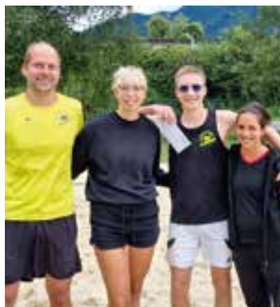
Platz 3 - „Die Zaumgwürfelten“