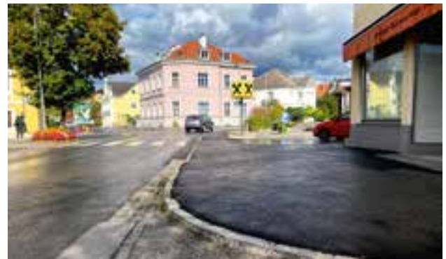
Asphaltierung des gesamten Gehsteigbereichs