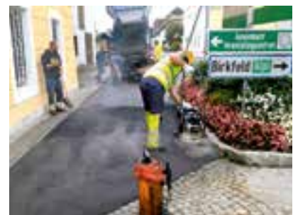
Asphaltierung des Gehsteigbereichs - Alplkreuzung