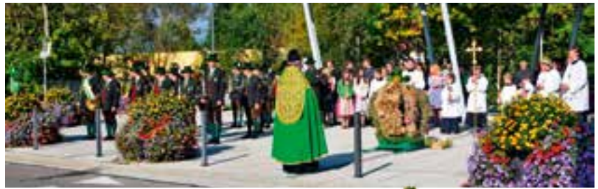
Segnung der Erntekrone

Ein großes Kompliment gilt der Landjugend Krieglach für das Gestalten der – wie immer – wunderschönen Erntedankkrone.