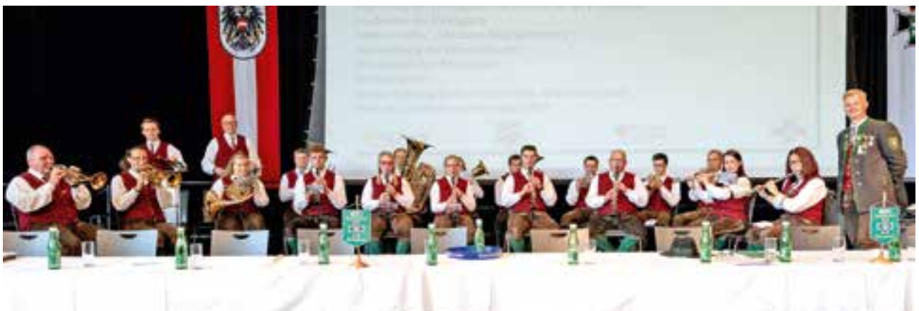
musikalische Umrahmung des ÖKB Landesdelegiertentages im VAZ Krieglach

Musiker bei einer weiteren Veranstaltung des ÖKB: Der ÖKB-Landesdelegiertentag wurde im Veranstaltungszentrum Krieglach abgehalten, zu dem fast 500 Kameraden aus allen Teilen des Landes geladen waren.