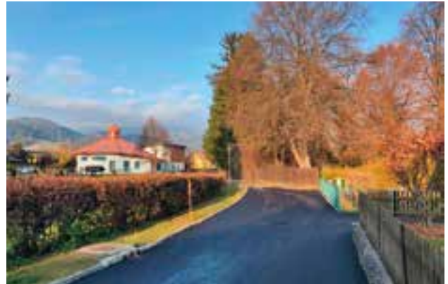
Das Brunngassl wurde ebenfalls saniert und eine neue Asphalt-schicht aufgebracht.