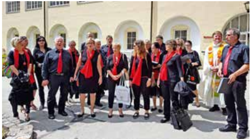
in St. Georgen am Längsee nach der Gestaltung des Gottesdienstes