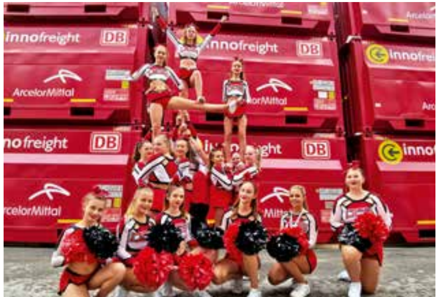
Auftritt in Slowenien

Auch eine kleine Auslandsreise war möglich. Für ihren Hauptsponsor Firma „Innofreight“ fuhren die Cheerleader im September mit dem Busunternehmen Allmer aus Krieglach zur Schwestern-Firmen Eröffnung, Firma Innoduler nach Slowenien und präsentieren ihre neuen Poms.