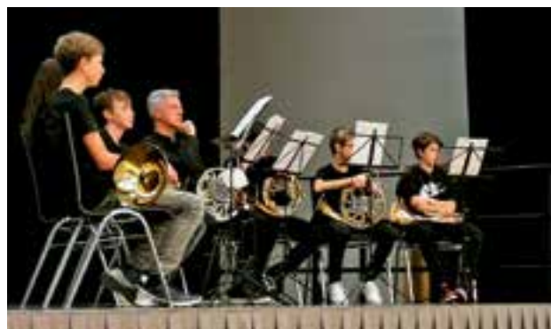
Hornensemble der Musikschule Krieglach