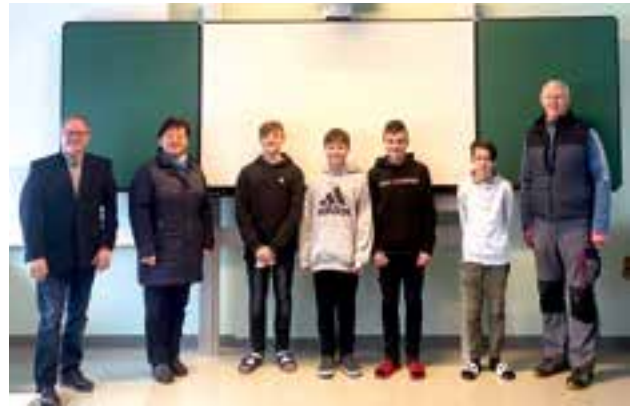
Mittelschule Krieglach – Whiteboards

Bildung unserer Kinder und Jugendlichen von immenser Wichtigkeit. Aber nicht nur die technischen Standards werden regelmäßig verbessert, auch die Sicherheit für das pädagogische Personal sowie für die Schüler wird ständig von externen Institutionen überprüft und evaluiert. Dazu zählen insbesondere die regelmäßigen Überprüfungen, die durch das Personal der Marktgemeinde Krieglach sowie von beauftragten Firmen, wie z.B. dem TÜV, durchgeführt werden. In regelmäßigen Abständen wird auch von der Fachaufsicht für Kindergärten bzw. der Bildungsdirektion, die für die Pflichtschulen zuständig ist, kontrolliert und auf Verbesserungen aufmerksam gemacht.