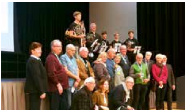
die Preisträger des Landesfotoschau 2021