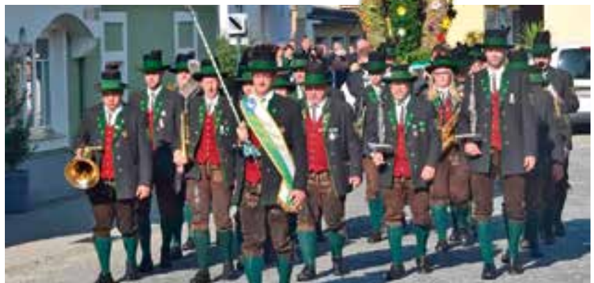
Festzug zur Pfarrkirche