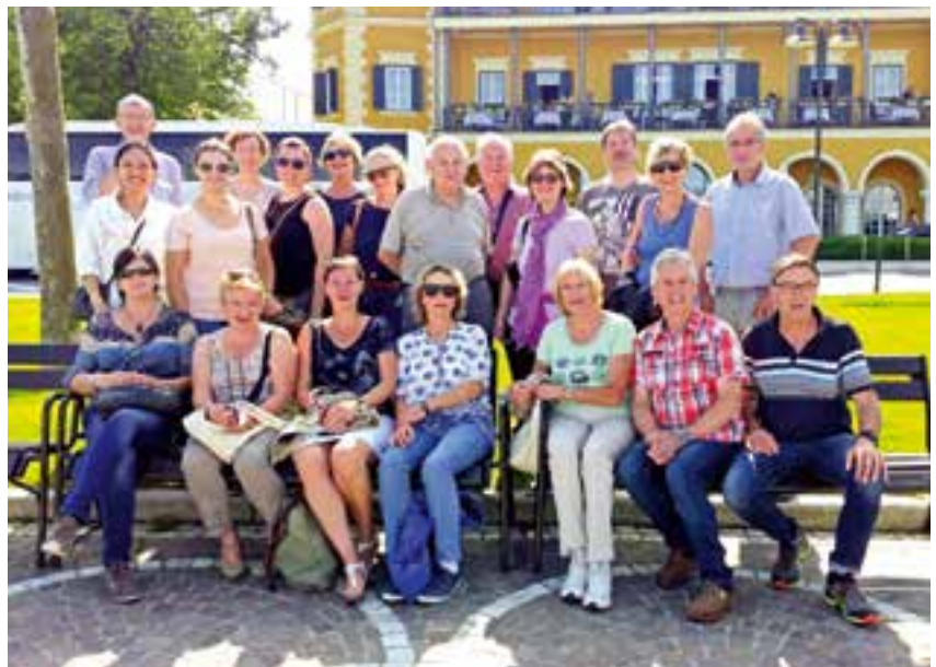
vor dem Schlosshotel in Velden