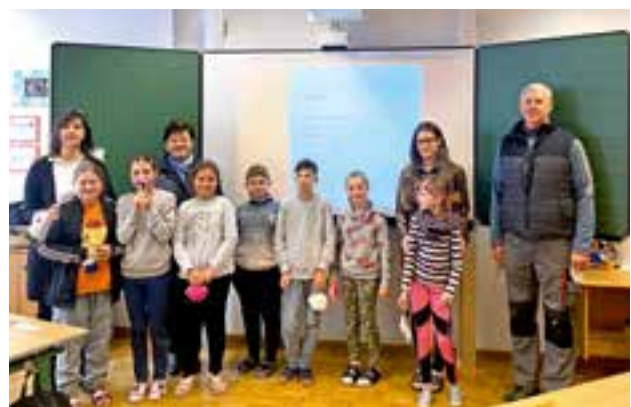
Allg. Sonderschule Krieglach – Whiteboards