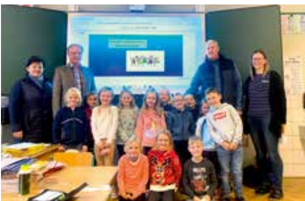
Volksschule Krieglach – Whiteboards

Mit Stolz dürfen wir berichten, dass wir von allen überprüfenden Organen stets äußerst positive Rückmeldungen bekommen und sich unsere Kinderbetreuungseinrichtungen und Schulen in einem hervorragenden Zustand befinden.