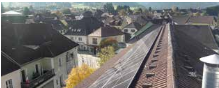
PV-Anlage – Volksschule