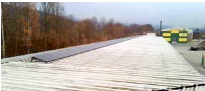
PV-Anlage – Bauhof / Einspeisung Bauhof und Altstoffsammelzentrum