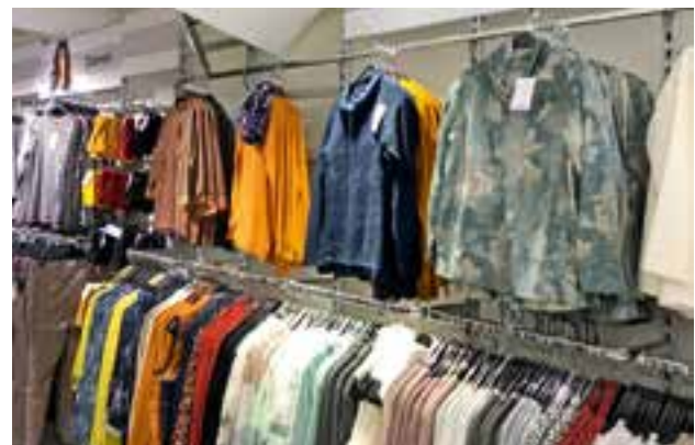
die neue NKD-Filiale am ehemaligen Standort der Bipa-Filiale in Krieglach, Rosseggerstraße 16