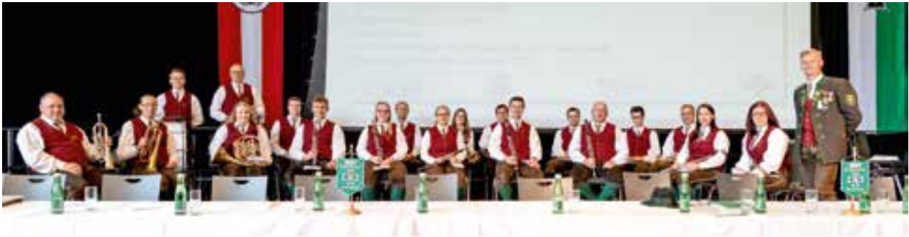
Musikkapelle voestalpine Roseggerheimat Krieglach

konnten wir in diesem Herbst endlich dieses so wichtige Ereignis durchführen. Mit rund 500 Delegierten aus allen Ecken unseres schönen Steirerlandes war es trotz der allgemeinen COVID-Beschränkungs-vorgabe ein gelungener Tag.