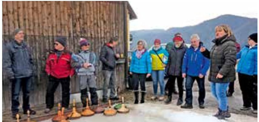
traditionelles Eisschießen gegen die Musikkapelle

In dieser heiklen Situation wollten wir nicht um jeden Preis eine Veranstaltung durchführen.