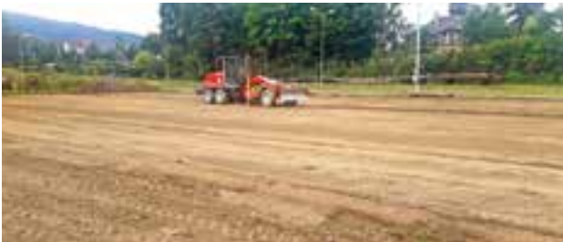
Vorbereitung des Untergrundes für den Eislaufplatz

Viel Spaß beim Eislaufen wünscht die Marktgemeinde Krieglach!