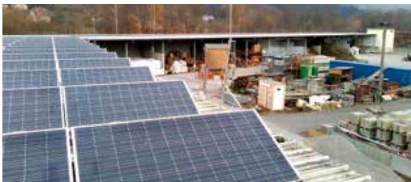
PV-Anlage – Bauhof / Einspeisung Gemeindezentrum

Die neuen Photovoltaik-Anlagen erforderten eine Investition von rd. € 85.000,00 , jedoch bekommt die Marktgemeinde Krieglach für diese klimaschonende Anschaffung auch Fördermittel von Bund und Land.