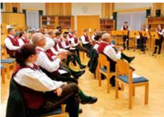
Jahreshauptversammlung im Haus der Musik