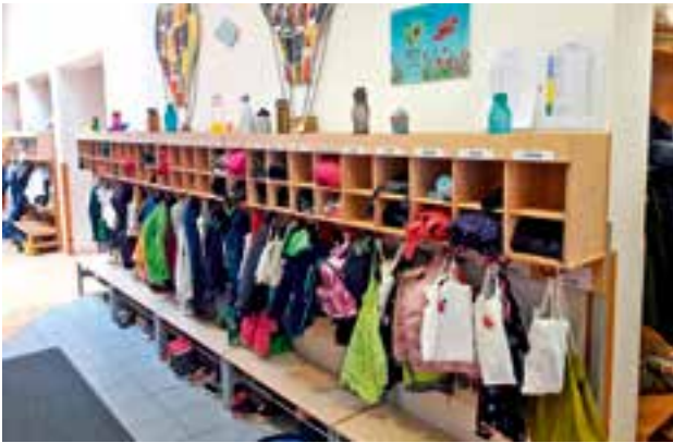
Kindergarten – neue Garderobenaufsätze