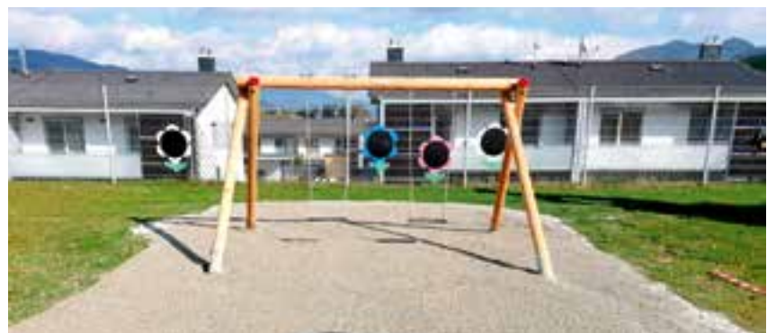
Kindergarten – Ergänzung Spielanlage

Die zeitgemäße Ausstattung unserer Kinderbetreuungseinrichtungen sowie der Krieglacher Schulen, für die die Marktgemeinde Krieglach als Schulerhalter zuständig ist, ist für die Marktgemeinde Krieglach von besonderer Wichtigkeit. Die Betreuung, sowie den Unterricht gemäß den neuesten Standards durchführen zu können, ist für die Entwicklung und