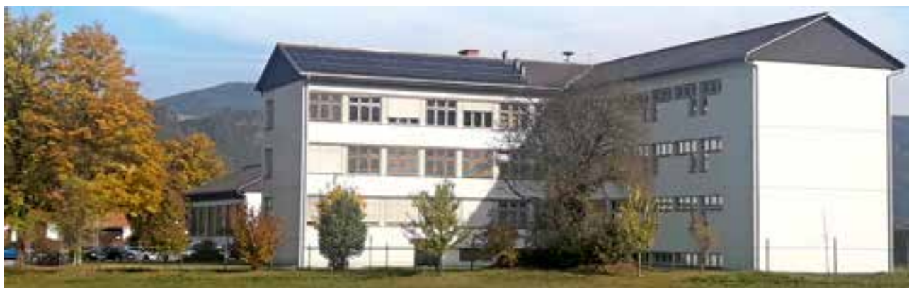
PV-Anlage – Mittelschule