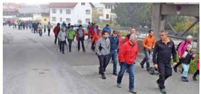
über den Wassertalweg in Richtung Gölk - Himmel