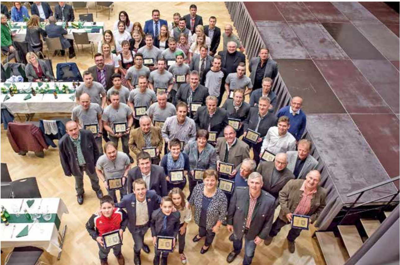
die geehrten Sportlerinnen und Sportler

Ein besonderer Höhepunkt der Veranstaltung war der Vortrag von Andreas Goldberger , der anhand seiner eigenen Lebensgeschichte vor Augen führte, welche Ziele man mit eisernem Willen erreichen kann. Der einstündige Vortrag war für die Gäste dieser Sportlerehrung sehr beeindruckend, denn es wurde von Andreas Goldberger nicht nur auf seine Erfolge, sondern auch auf seine Misserfolge und Rückschläge eingegangen, die er jedoch mit eisernem Willen und viel Disziplin in Motivation umgesetzt hat, sodass er schon bald wieder zur Elite im Skispringen und Skifliegen zählte. Das Wichtigste im Leben ist, dass man das, was man tut, gerne tut, um glücklich und erfolgreich zu sein.