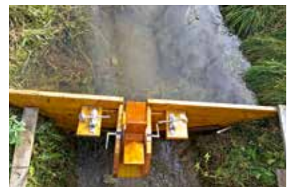
Wasserrad - Höllbach

gentümer sowie der FF Krieglach für die Organisation der Bewirtung am Schluss der Wanderung. Dieser Wandertag am Nationalfeiertag, wird auch im nächsten Jahr, am Donnerstag, dem 26. Oktober 2018 stattfinden. Wir freuen uns wieder auf eine rege Teilnahme.