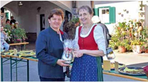
Frau Bürgermeisterin erhielt einen Krieglachkrug als Erinnerung an diesen schönen Ausflug