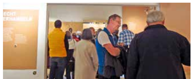
Besuch der Niederösterreichischen Landesausstellung in Pöggstall