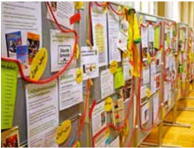
ein Überblick über die zahlreichen Projekte