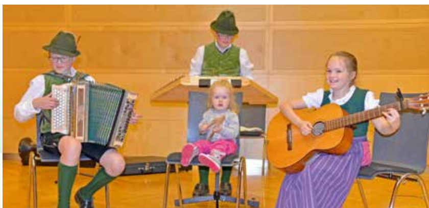
musikalische Umrahmung - Zwickl Trio