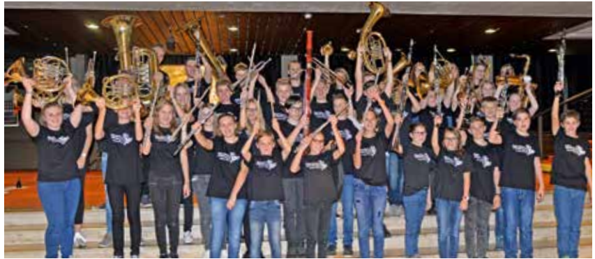
Jugendblasorchester der Musikschule Krieglach

Für seine großartige Leistung beim Landeswettbewerb wurde das JBO (Jugendblasorchester)