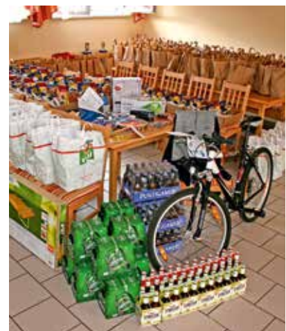
Verlosung von Warenpreisen - Vereinsmeisterschaft