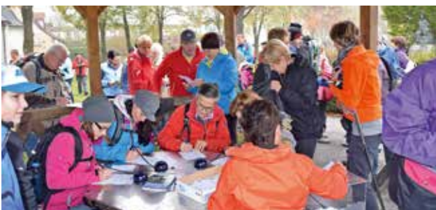
viele Teilnehmer beteiligten sich am Quiz

Der von Peter Rosegger hochgeschätzte Aussichtspunkt „Himmel“ , der sich unmittelbar in der Nähe der Labstation befand, wurde von vielen Wanderern – teilweise das erste Mal - besucht. Ein herzliches Danke an die Obfrauen der veranstaltenden Ausschüsse,