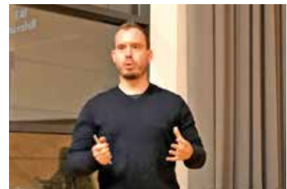
Interessantes zum Culture Recovery Projekt der EU von Thomas Huemer

Wenn Sie über besondere Fähigkeiten verfügen bzw. ein besonderes Wissen besitzen, zögern Sie nicht und melden Sie sich im Marktgemein-