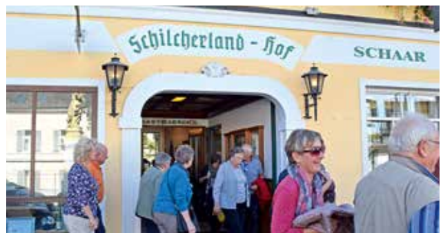
die Krieglacher wurden im Schilcherlandhof bestens gepflegt