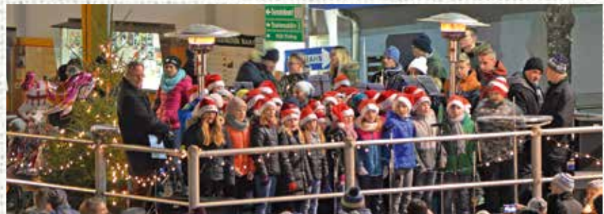
Auftritt der Kinder unserer Volksschule

Die alljährliche Adventauftaktveranstaltung am Krieglacher Hauptplatz stellt den offiziellen Beginn der Adventzeit in unserem Ort dar und wurde heuer im Rahmen des Waldheimatmarktes im Advent durchgeführt. Die Gäste konnten das traditionelle Entzünden der Weih-