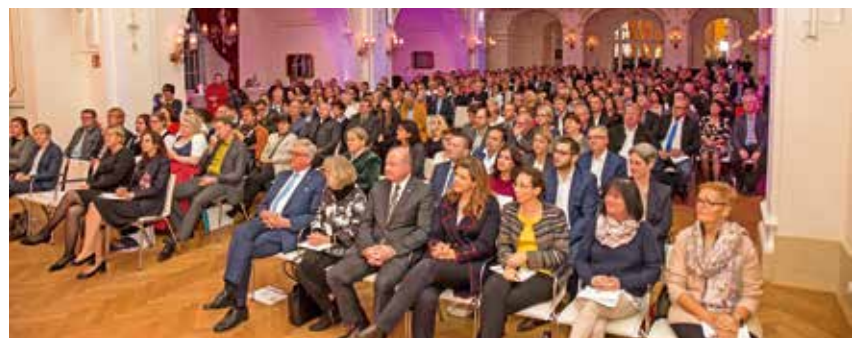
in einem festlichen Rahmen im Sparkassensaal Wr. Neustadt fand die Verleihung der Zertifikate statt