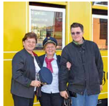
mit Volldampf von Stainz nach Preding