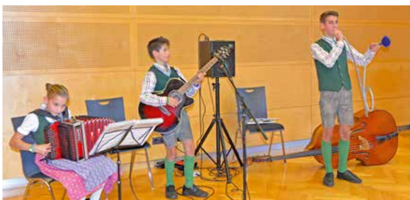
musikalische Umrahmung - Mißebner Trio