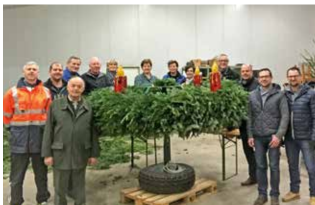
binden des Adventkranzes im Bauhof

Der Krieglacher Bevölkerung, den Kindern und Jugendlichen und allen Gästen wünschen wir bei der Betrachtung der Weihnachtsdekoration vor dem Gemeindeamt viel Freude und hoffen, dass diese zur vorweihnachtlichen Stimmung beiträgt.