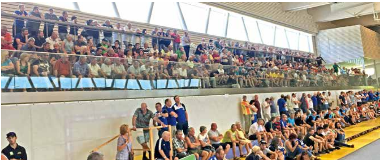
über 1.000 Besucher verfolgten das Staatsligafinale in Krieglach