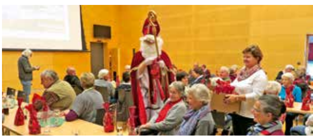
der Nikolaus kam zu Besuch und überreichte den Gästen einen süßen Gruß

Auch im nächsten Jahr werden die Pensionistennachmittage fortgesetzt und wir freuen uns, zahlreiche Besucher zu den verschiedensten Veranstaltungen, jeweils am 1. Dienstag im Monat begrüßen zu dürfen.