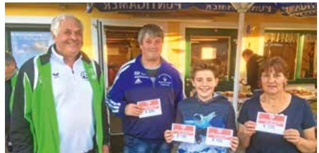
Gewinner der Hauptpreise gesponsert von der Fa. Unterberger