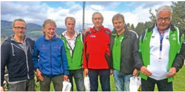
1. Platz - Mannschaft Harald Klammer