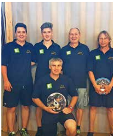
Kampfmannschaft TUS Krieglach