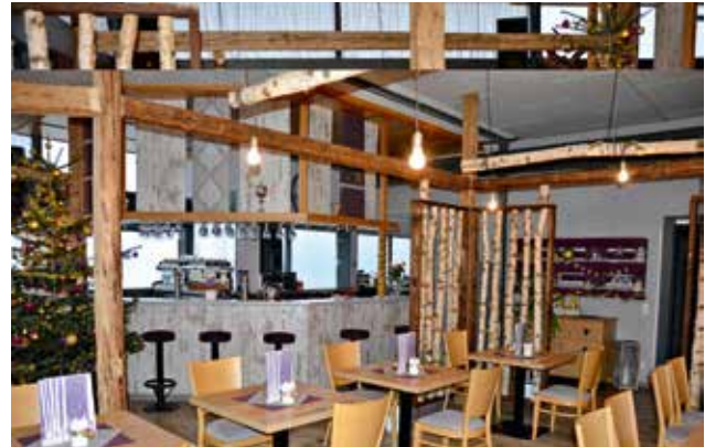
Raumteiler und Dekoration