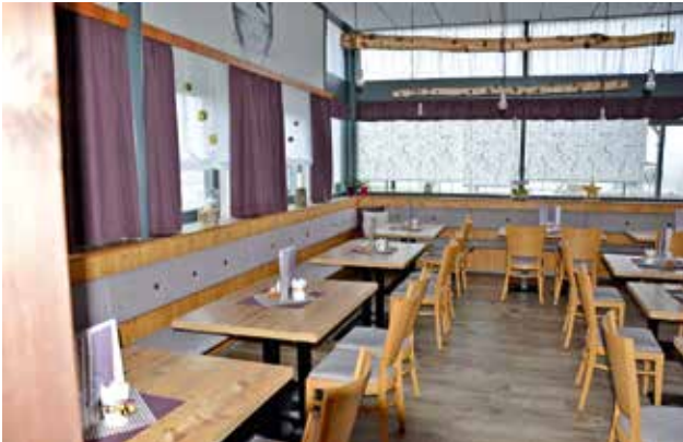
neu gestalteter Gastraum

Während der Wintermonate hat das Seegasthaus von Mittwoch bis Sonntag in der Zeit von 9.00-21.00 Uhr geöffnet und wird als fixen Bestandteil neben einem Mittagmenü auch das beliebte Frühstück anbieten.