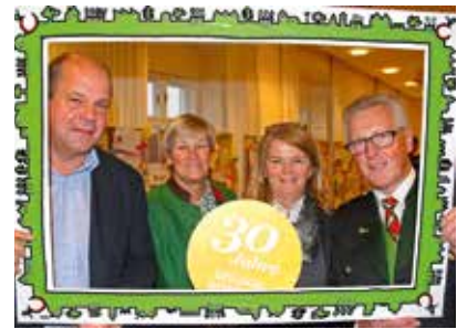
die Abordnung aus Krieglach

Am 17. November hat Styria vitalis das 30-jährige Bestandsjubiläum mit vielen Gästen und Wegbegleitern im Schloss St. Martin in Graz gefeiert. Die Marktgemeinde Krieglach ist seit mehr als 20 Jahren Mitglied der Gesunden-Gemeinde-Vereinigung und hat bereits viele Projekte zur Gesundheitsförderung erfolgreich umgesetzt. Die Vereinigung Styria vitalis ist unermüdlich in der gesamten Steiermark tätig, um neue Projekte vorzustellen und deren Umsetzung im Sinne der Förderung der Volksgesundheit, voranzutreiben. Die Marktgemeinde Krieglach war beim 30-Jahresfest in Graz durch die