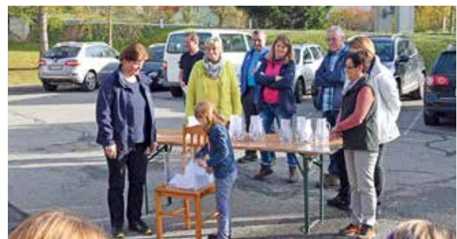
Verlosung schöner Preise