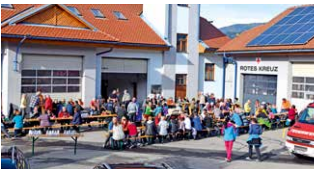
Abschluss beim Rüsthaus der FF Krieglach