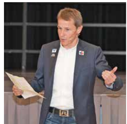
Vortrag über die Höhen und Tiefen im Spitzensport von Skisprunglegende Andi Goldberger

Die Marktgemeinde Krieglach lud am Mittwoch, dem 15. November zur Sportlerehrung in das VAZ Krieglach ein, um den erfolgreichen Sportlerinnen und Sportlern aus Krieglach zu ihren Leistungen zu gratulieren und allen Verantwortlichen für ihren Einsatz auf dem sportlichen Sektor zu danken.