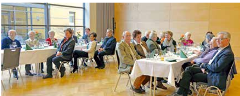
Jubilarfeier im November