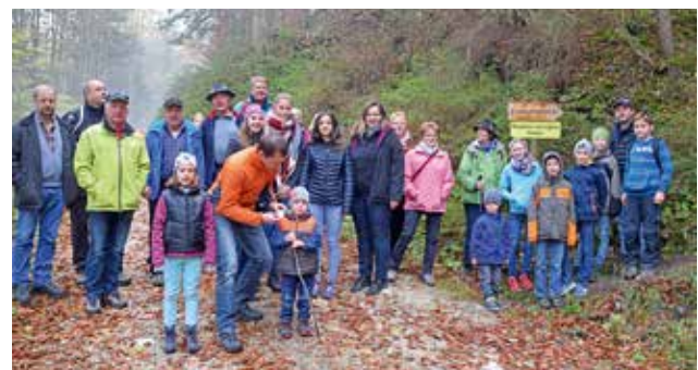
Gruppenweise wurde der berühmte Rückzugsort Peter Roseggers besucht