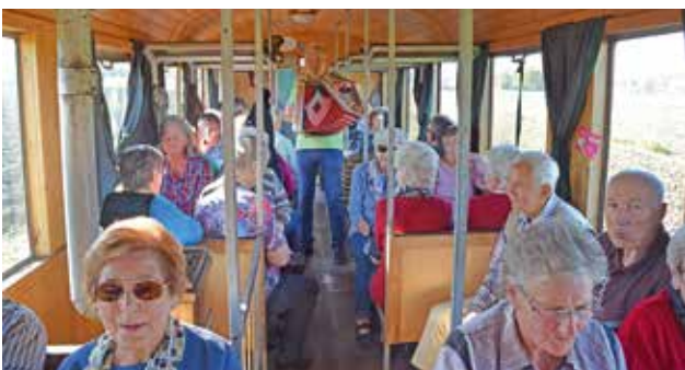
die Fahrgäste wurden im Zug musikalisch unterhalten