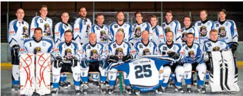
Ice Pirates Krieglach