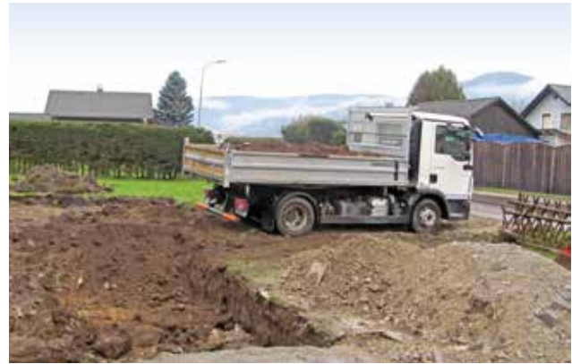
Errichtung eines Zubaus - mit den Erdbewegungsarbeiten wurde bereits begonnen