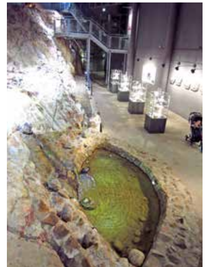
Amethystwelt in Maissau