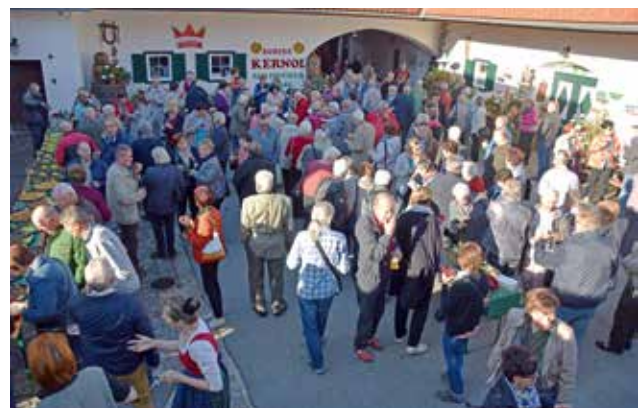
Empfang der Krieglacher in der Erlebniswelt Farmer-Rabensteiner