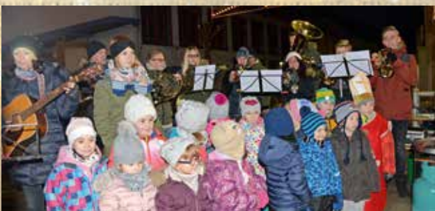
Darbietungen des Gemeinde- und heilpädagogischen Kindergartens sowie der Musikschule Krieglach