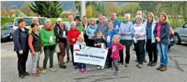
Familienwandertag unter dem Motto - Gesunde Gemeinde bewegt