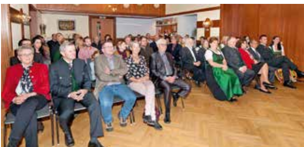
die Festversammlung im großen Saal des Gasthofes Rothwangl

Allen Geehrten darf noch einmal ein herzliches Dankeschön für ihre Leistungen zum Wohle unserer Gemeinde ausgesprochen und zur Auszeichnung gratuliert werden!