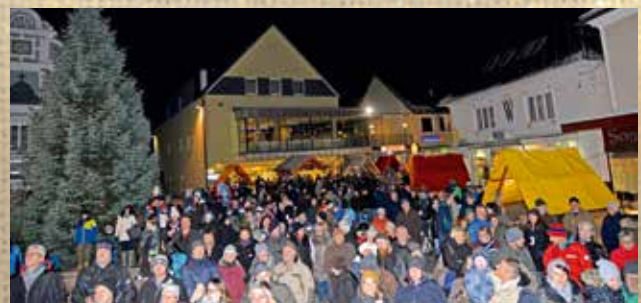
viele Gäste besuchten den Waldheimatmarkt und die Adventauftaktveranstaltung