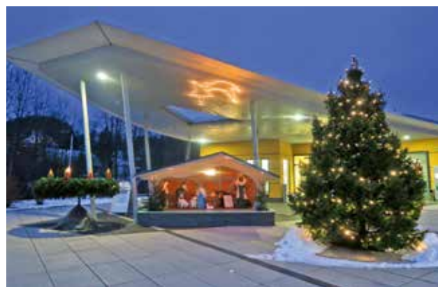
vorweihnachtliche Stimmung vor dem Gemeindeamt