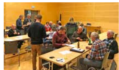
rund 30 interessierte Bürgerinnen und Bürger bei der Auftaktveranstaltung