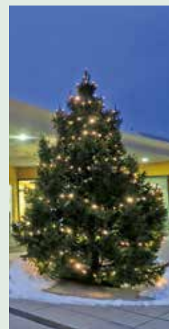
Hausge- meinschaft Dr. Max- Mell- Straße 7 Gemeinde- amt - außen