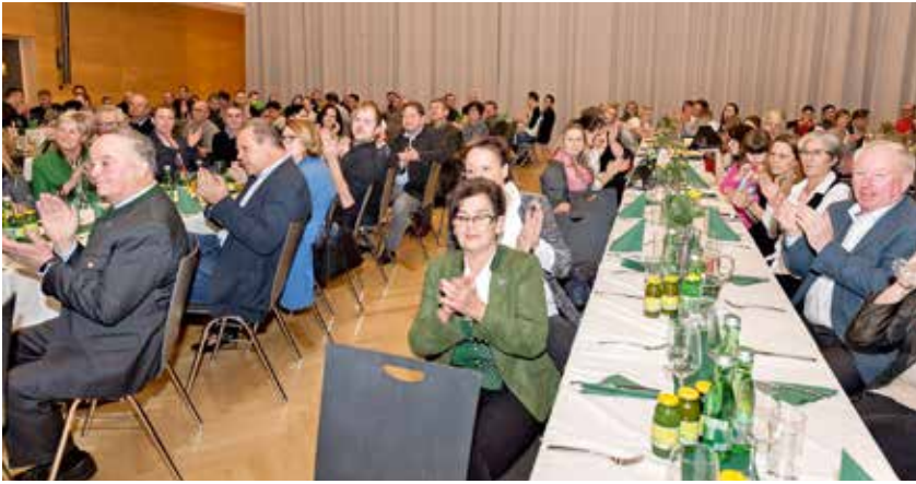
die Festversammlung im großen Saal des VAZ

hervorragenden Leistungen, sondern dankte auch für deren Durchhaltevermögen und Fleiß sowie den vielen Funktionären, die mit enormen Einsatz für einen ausgezeichneten organisatorischen Ablauf sorgen und ständig bemüht sind, die finanziellen Mittel aufzubringen um ihre Sportler bestmöglichst zu unterstützen.