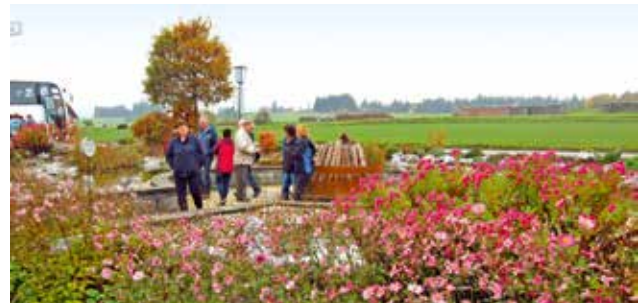
Besichtigung des Mohndorfs in Armschlag

Die aktiven und pensionierten Gemeindebediensteten wurden von 20. bis 22. Oktober zum alljährlichen Betriebsausflug eingeladen, der im heurigen Jahr in das südliche Waldviertel führte.