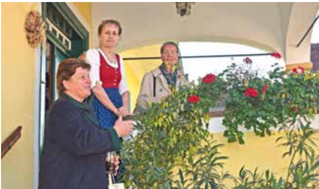
Frau Bgm. bedankt sich bei Fam. Farmer-Rabensteiner für die herzliche Aufnahme