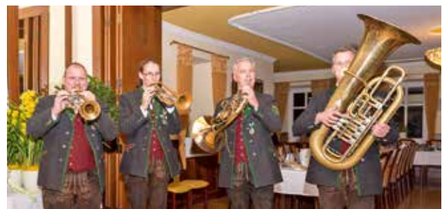
musikalische Umrahmung durch ein Bläserensemble der Musikkapelle Krieglach