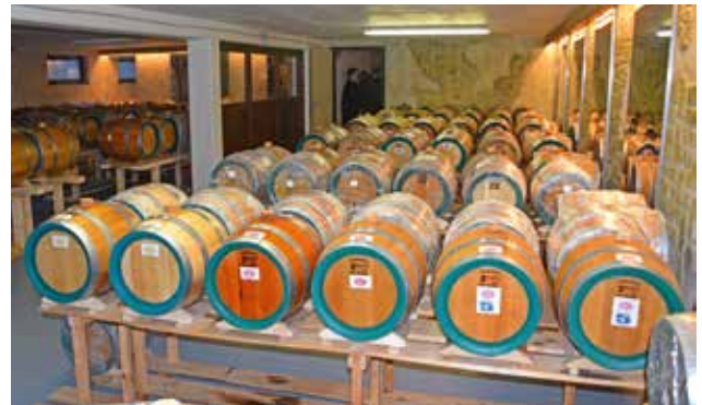
im Essigkeller reifen spezielle Essigsorten

Am Mittwoch, dem 19. Oktober veranstaltete die Marktgemeinde Krieglach ihren alljährlichen, bereits zur Tradition gewordenen Herbstausflug für die Krieglacher Pensionisten. Am Vormittag wurde die Genuss- und Erlebniswelt Farmer-