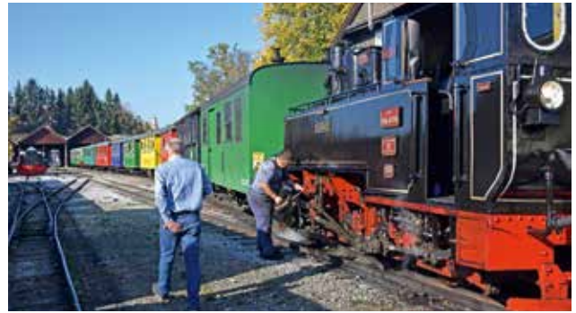
Flascherzug - letzte Wartungsarbeiten vor der Abfahrt

stammen aus dieser Tonmanufaktur mit lange zurückreichender Tradition. Die mehrfach prämierten Spezialleste der Familie Farmer-Rabensteiner reifen unter optimalen Bedingungen in Glasballonen und stellen für den Kenner eine besondere Gaumenfreude dar. Nach dem Mittagessen im Schilcherlandhof in Stainz wurde der Pensionistenausflug unter dem Motto „ Mit Volldampf durch das Schilcherland bis Preding “ fortgesetzt. Auf den Spuren des