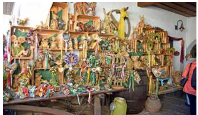
kunstvoll gestaltete Figuren aus Heu