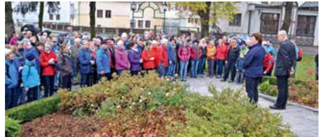
Festakt zu Ehren 80 Jahre Roseggerpark

Am 26. Oktober waren die Krieglacher Bevölkerung sowie die Gäste zum dritten Krieglacher Familienwandertag, veranstaltet und organisiert von der Marktgemeinde Krieglach, eingeladen. Der diesjährige Familienwandertag stand unter dem Motto „ Gesunde Gemeinde bewegt “ aufgrund des 30-jährigen Jubiläums von „Styria vitalis“.