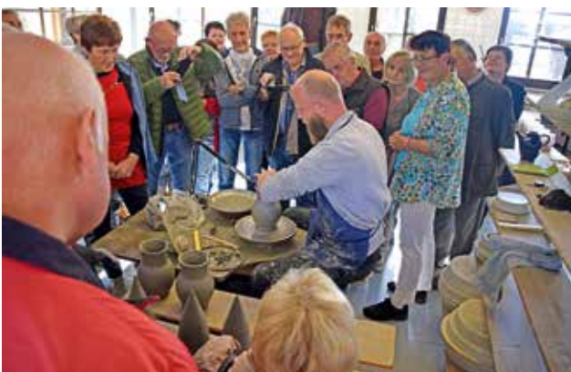
Bad Gamser Tonmanufaktur